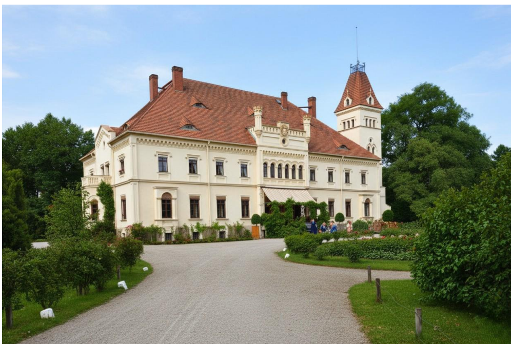
Rys. 4. Pałac w Borku.

Dolnołużyckie posiadłości: Krosno ( Crossen ), Sulechów ( Züllichau ) i Lubsko ( Sommerfeld ), będące niegdyś częściami składowymi śląskiego państwa Piastów, przeszły w XV wieku w ręce domu brandenburskiego jedynie z prawem odkupu, choć w XVI wieku zostały mu nadane w lenno. Powracanie do tych starych żądań było co najmniej przestarzałe, lecz w obliczu zaostżenia antagonizmów między Brandenburgią a Austrią za czasów Wielkiego Elektora stanowiło wówczas aktualny zarzut wykorzystywany w dyplomatycznych rozgrywkach.