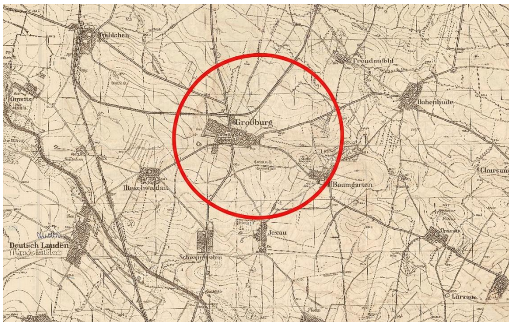
Rys. 3. Sporny Borek.

roku. Przy tej okazji wspomniano również o wydarzeniach w Borku, mimo że od ich zajścia upłynęły już dwa lata.