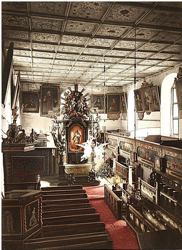
Großburg, Kreis Strehlen

przed moimi prześladowcami i wybaw mnie». Po kazaniu odśpiewano Syon narzeka w lęku i bólu , wypowiedziano błogostawieństwo i tym samym akt ten w imię Boże zakończono”.