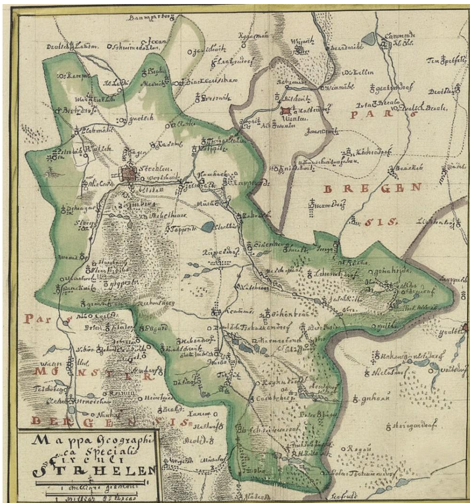
Rys. 2. Mapa okolic okręgu Strzeleńskiego.

„Wojną w czasie pokoju” można by nazwać wydarzenia, które rozegrały się w roku 1654 w Borku Strzeleńskim ( Großburg ) koło Strzelina: wielokrotne usuwanie ewangelickiego pastora przez cesarską Komisję Redukcyjną oraz jego powtórne przywrócenie na urząd przez oddział brandenburskich dragonów. Choć była to sprawa o znaczeniu przejściowym, zasługuje na bliższą uwagę jako ogniwo w łańcuchu relacji Wielkiego Elektora z dworem cesarskim, a zarazem niepozbawiony interesujących cech sukces dyplomatyczny polityki brandenburskiej nad cesarską.