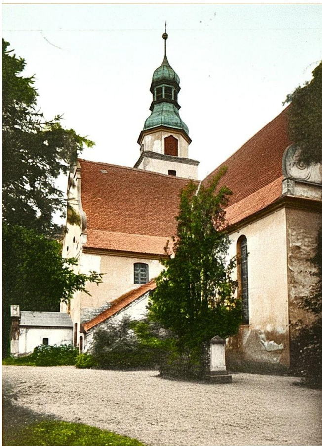
Großburg, Kreis Strehlen