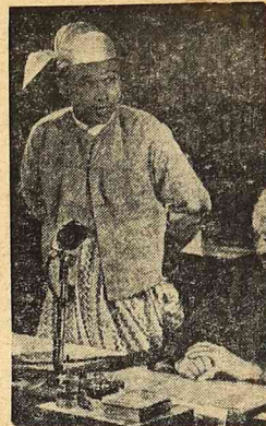
Przyszły pierwszy premier niepodległej Birmy Thakin Nu podpisuje wraz z brytyjskim premierem Attlee traktat anglo-birmański. Niezależność Birmy ma być ogłoszona w dn. 6 stycznia br.