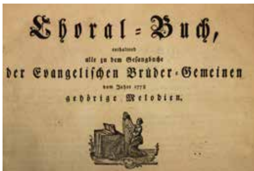
Christian Gregor, Choral-Buch, enthaltend alle zu dem Gesangbuche der Evangelischen Brüder-Gemeinen vom Jahre 1778 gehörige Melodien, Leipzig 1784

W 1756 r. Christiana Gregora wyświęcono na diakona, a następnie został dyrektorem muzycznym Kościoła Morawskiego w Herrnhut. W 1759 r. powstają jego pierwsze kompozycje muzyczne. W 1764 wybrano go członkiem administracji wspólnoty, gdzie zajmował się aspektami księgowymi. Kościół Braci Morawski prowadzi aktywną politykę misyjną, która staje się istotną częścią życia i pracy Gregora. W latach 1770–1772 wyjeżdża do Ameryki Północnej, a w 1774 r. wyrusza do Sarapety nad Wołgą w Rosji (odwiedza też wtedy Estonię, Łotwę i Sankt Petersburg). W latach 70. XVIII w. Gregor zbiera hymny i tworzy własne kompozycje. W 1778 r. ukazuje się drukiem Księga Hymnów, a w 1784 r. na prośbę wspólnoty przygotowana zostaje Księga Chorałów. W 1789 r. został wybrany biskupem Kościoła Morawskiego i na tym stanowisku jest aktywny do ostatniego dnia swego życia 6. listopada 1801 r. Umiera na wylew w swoim domu w Berrthelsdorf, nieopodal Herrnhut.