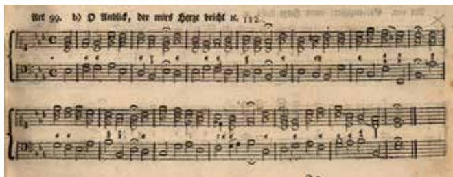
O Anblick, der mir's Herze bricht! [w:] Christian Gregor, Choral-Buch ..., Leipzig 1784

ba, by pozostał zawsze przy Jezusie. W 1738 r. ma miejsce symboliczne dla niego zdarzenie, gdy pewnego letniego dnia wchodzi wraz z kolegą na dzwonnice przereczyńskiej świątyni. W kościelną wieżę nieoczekiwanie uderza piorun, który niszczy podłogę nad nimi i dwa piętra niżej, jednak bez uszczerbku dla chłopców.