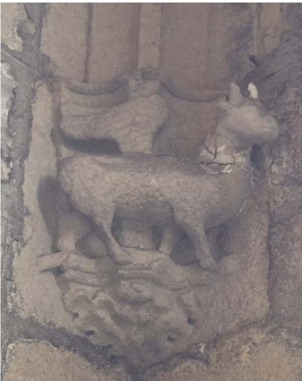
Stier = Attribut LUKAS

Die Reihenfolge von Stier und Löwe wurden vertauscht.