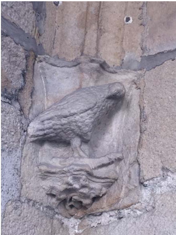
Adler = Attribut Johannes