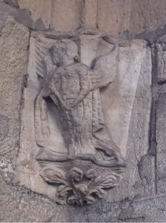
Engel = Attribut MATHAEUS