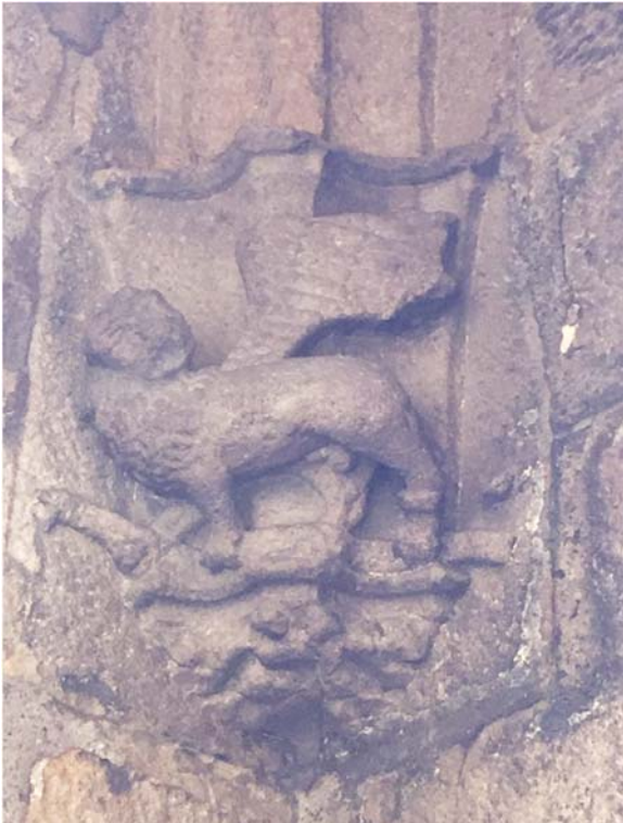
LÖWE = Attribut MARKUS

Die Gewölberippen der Turmhalle stützen sich auf die Attitute der Evangelisten.