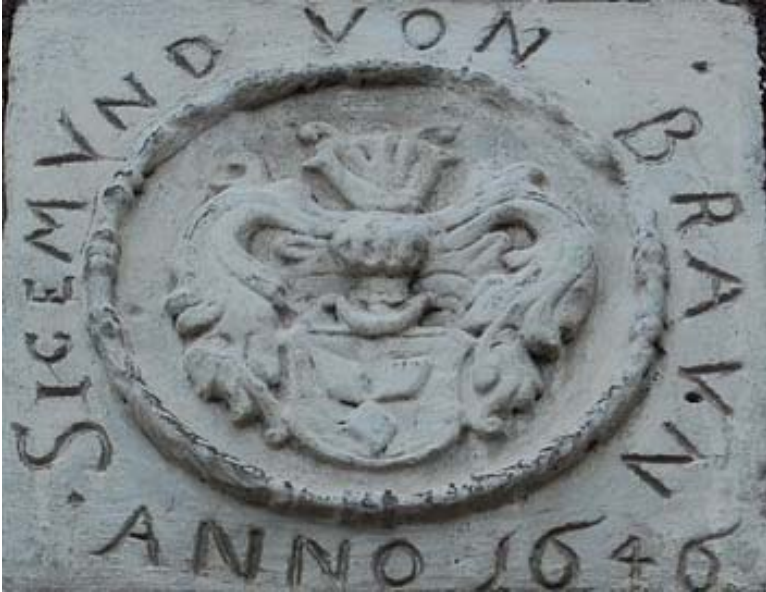
Wappen am Gut in Wiesenthal