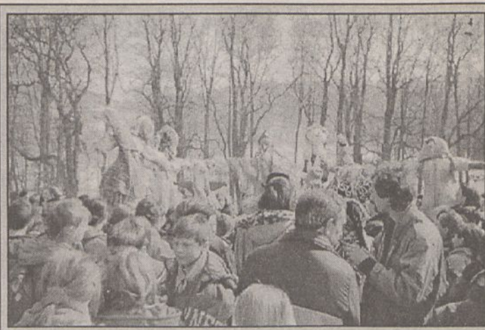
W „Dzień wagarowicza”