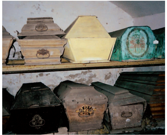
Särge in der Krypta Schaffgotsch Trumny w krypcie Schaffgotschów

gotsch, Majoratsherr auf Warmbrunn. (Gemahl der Vorigen.) * 5.05.1793, † 19.10.1864.