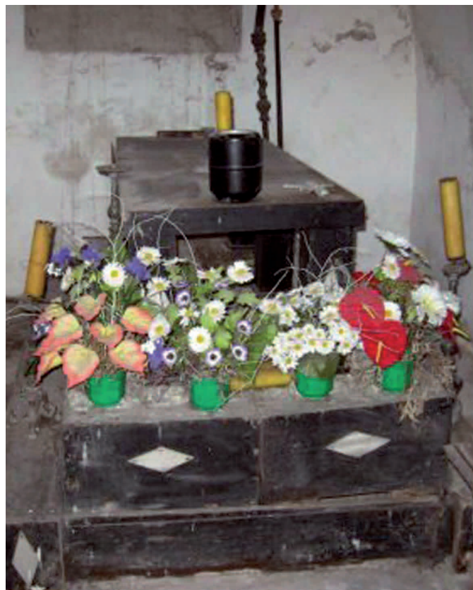
Sarkofag mit Grabschmuck Sarkofag z dekoracją nagrobną