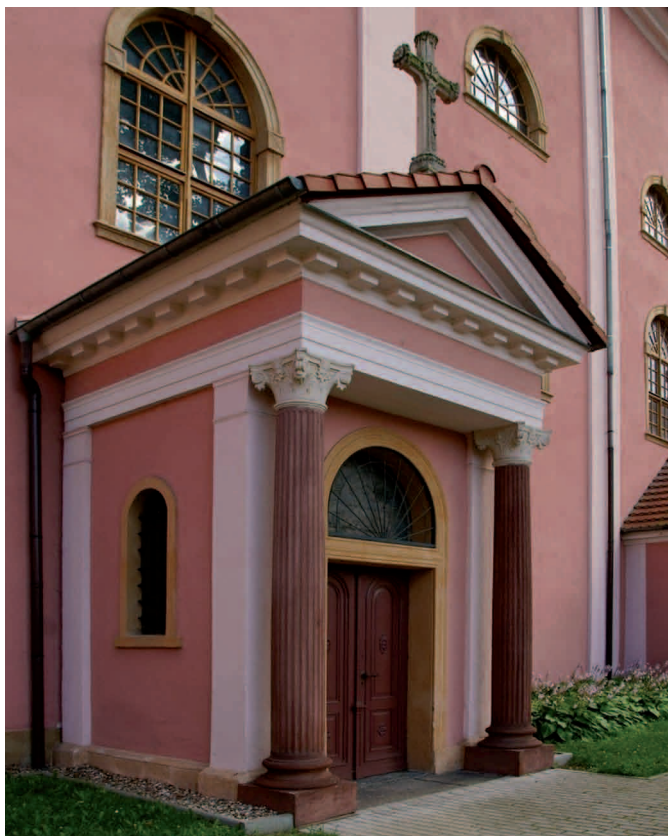
Eingang zur Schaffgotsch-Gruft Wejście do krypty Schaffgotschów

trumna 17: hrabina Josephine Clementine Schaffgotsch, z domu hrabina von Zieten, ur. 23.10.1799, zm. 24.2.1862 (od jej imienia wzięła nazwę huta Józefiny / niem. Josephinenhütte / w Szklarskiej Porębie/ dziś