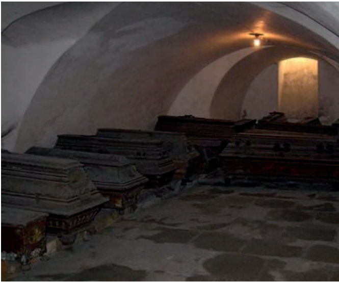
Ansicht der Schaffgotsch-Gruft Widok krypty Schaffgotschów