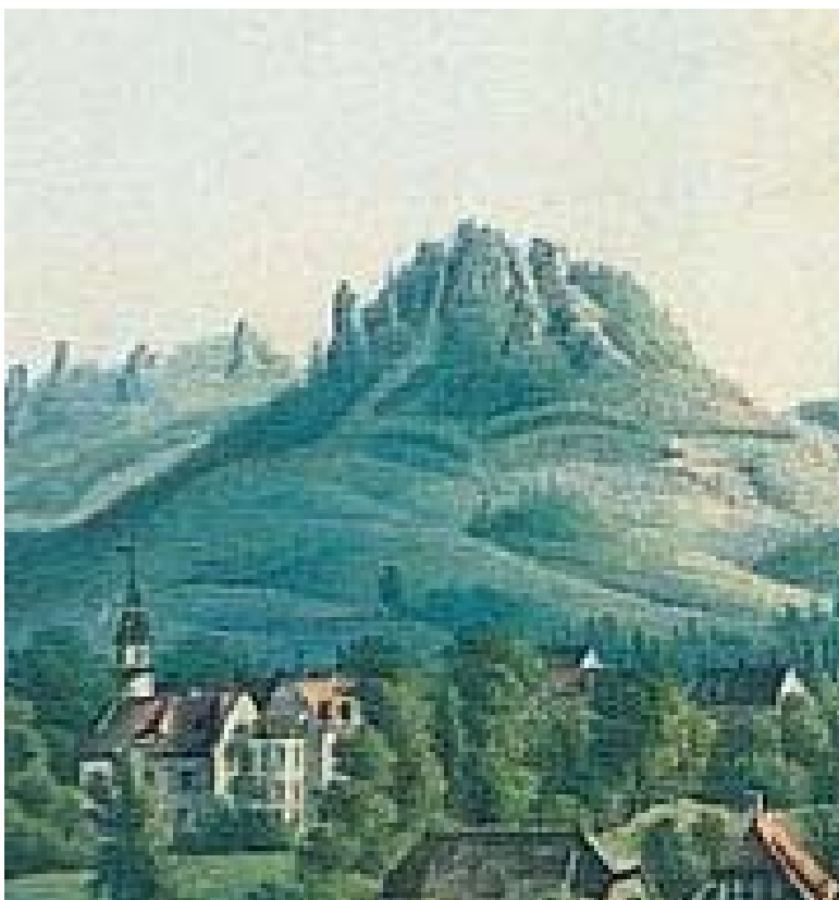
Fischbach mit dem Falkenstein

Im Nordosten des Dorfes erhebt sich das nach ihm benannte Fischbacher Gebirge, auf dessen Kamme sich eine Felsengruppe befindet, die sonst der Backofenstein genannt wurde, aber seit dem 13. Oktober 1824, dem Geburtstage Ihrer Königl. Hoheit der Prinzessin Wilhelm, den Namen Marienfels führt. Ein in Eisen gegossener kolossaler Löwe, von Professor Rauch in Berlin geformt, zierte seit jener Zeit diese Felsenpartie. Im Sommer 1832 wurde auf dem höchsten Gipfel des Falkenberges ein sehr großes eisernes Kreuz (auf Veranstaltung der Prinzessin Wilhelm Königl. Hoheit in der Königl. Eisengießerei zu Gleiwitz gegossen) aufgerichtet. Es wiegt 40 Centner, besteht aus 3 Teilen, die Säule ist einige Fuß tief in den Granitfelsen eingelassen, ragt noch 21 Fuß über denselben, und die Arme sind 18 Fuß breit. Dieses Kreuz, welches eine Meile weit mit bloßen Augen gesehen wird, hat die Inschrift: Des Kreuzes Segen über Wilhelm, seine Nachkommen und das ganze Tal! – Im Nordwesten erhebt sich der Brauerberg; im Süden der Antonienstein, sonst Brauthügel genannt, eine Höhe, zu der viele gebahnte Wege als liebliche Spaziergänge führen. Im Südosten steigt der Kittnerberg hervor, in welchem einer alten Sage zufolge ein goldener Esel ruhen soll, dessen Wert im Fall seines künftigen Auffindens vollkommen hinreichen werde, um Fischbach in eine Stadt zu verwandeln. Der Finder diese- Esels werde die Stadt gründen und der ersten Bürgermeister in derselben sein. –