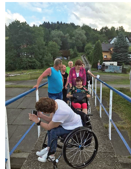
Uczestnicy projektu podczas wyjazdu integracyjnego do Brennej.