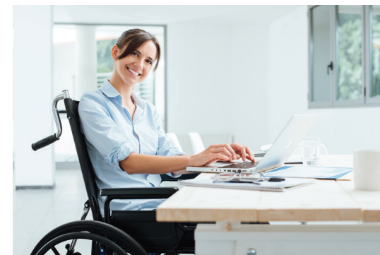
Tylko co siódmy badany ma stałą pracę.

Widać więc wyraźnie, że sytuacja nie jest dobra, a do zrobienia – bardzo dużo. Autorzy raportu proponują wpro-