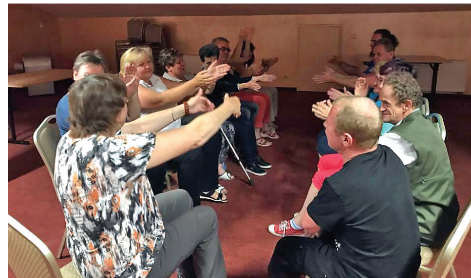
Uczestnicy projektu podczas warsztatów integracyjno-motywujących w Brennej.