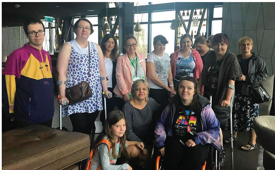
Uczestnicy projektu podczas wizyty w hotelu Marriott w Warszawie.

przewiduje się, że w tym czasie zostanie zaktywizowanych co najmniej 56 osób z niepełnosprawnością, z czego minimum 33 procent podejmie zatrudnienie na otwartym rynku pracy. W chwili obecnej większość Uczestników odbywa staże, a kilka osób już znalazło zatrudnienie. Projekt realizowany jest na terenie województwa dolnośląskiego, śląskiego oraz mazowieckiego. Wymiernym efektem zakończonej już I edycji projektu jest zatrudnienie 22 osób oraz nawiązanie porozumień wolontaryjnych przez 3 osoby.