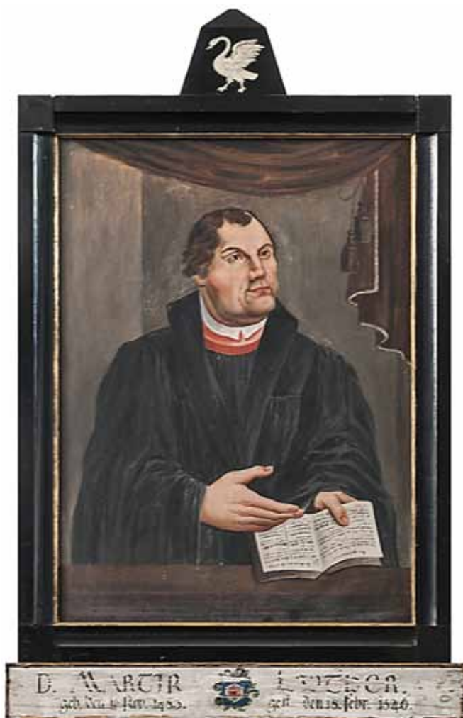
D. M. Martin Luther geb. den 10. Nov. 1483, gest. den. 18. Febr. 1546 Bild in der ev. Kirche zu Bad Warmbrunn, oben der weiße Schwan Martin Luther ur. 10.11.1483, zm. 18.02.1546 obraz w ewangelickim kościele w Cieplicach, u góry biały łabędź