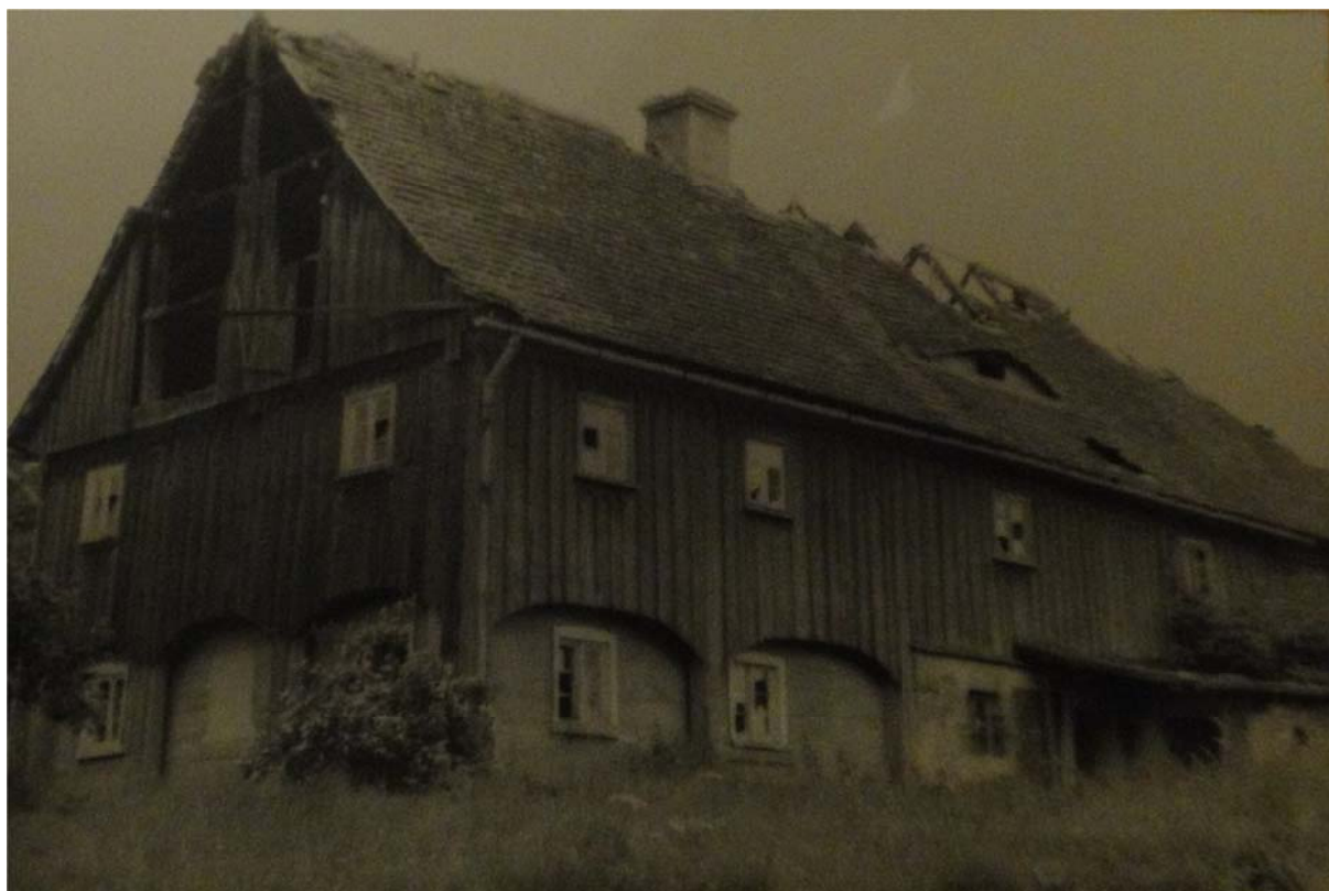
Budynek w Zalipiu.

się zdobiona ambona i rzeźba Matki Boskiej z początku XVI wieku. Na zewnętrznej ścianie od strony zakrystii znajduje się 14 płyt nagrobnych, między innymi z I połowy XVII wieku. W murze otaczającym plac kościelny zwraca uwagę ciekawa brama, domkowa, murowana z cegły. Kolejny cenny zabytek to spichlerz zbudowany w latach 1510-17 (Platerówka 52) jako dwór Vigandusa de Saltza. Przebudowany w II połowie XVII wieku i na początku XIX. Ten trzykondygnacyjny budynek, kryty dachem dwuspadowym z naczółkami, wykorzystywany jest obecnie jako punkt skupu zboża. We wnętrzu nad wejściem umieszczony jest słabo czytelny herb, nad którym widnieje kamienna tablica fundacyjna.