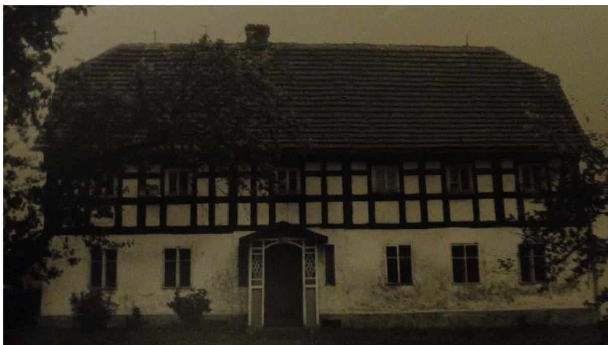
Budynek we Włosieniu.

Nieprzypadkowo pierwszą jednostką terytorialną, którą objęto inwentaryzacją była gmina Platerówka (12.35.), miejsce osiedlenia się żołnierzy z Samodzielnego Batalionu Kobiecego im. Emilii Plater. Wioska, w której przede wszystkim zamieszkały to Zalipie Dolne, przemianowane później na Platerówkę. Nie jest to jednak jedyna wioska, w której mieszkają Platerówki. Dlatego też w roku 1975, kiedy wprowadzono nowy podział administracyjny kraju, stworzono na niewielkim obszarze gminę obejmującą 4 wsie: Platerówkę, Włosień, Zalipie (dawne Zalipie Górne) i Przylasek. Dzięki temu zabiegowi wszystkie osadniczki wojskowe są „razem”. Pracują i starają się o poprawę swoich warunków bytowych i kulturalnych. W terenie tym działa: Gminny Ośrodek Kultury, Szkoła Podstawowa w Platerówce i we Włosieniu, Zasadnicza Szkoła Zawodowa o kierunku rolniczym (Włosień) oraz biblioteka publiczna, gdzie znajduje się Izba Pamięci Narodowej, do powstania której przyczynił się Śląski Okręg Wojskowy (wkład pracy) oraz Urząd Gminy (finanse). W skład zbioru tam zgromadzonego wchodzi pamiątki ze szlaku bojowego, urna z ziemią spod Lenino, sztandary: ZBOWiD-u i gminy oraz zdjęcia z I i II Złotu Platerówek.