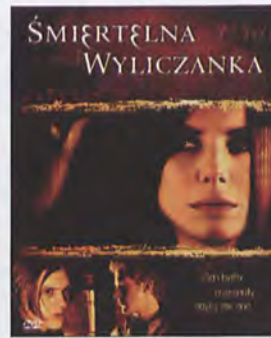
ŚMIERTELNA WYLICZANKA reż. Barbet Schroeder