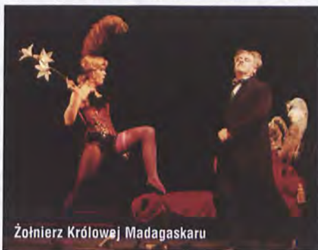
Żołnierz Królowej Madagaskaru