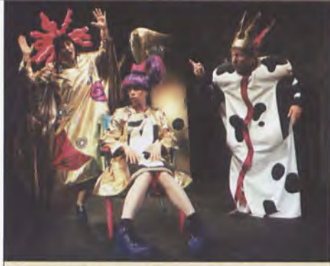
„Czarodziejskie krzesiwo”, reż. Jerzy Bielunas Wrocławski Teatr Lalek 1, 2 i 4 lutego, fot. M. Grotowski