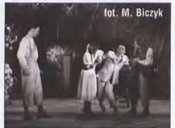
fol. M. Biczny