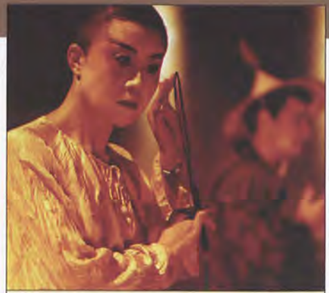
„Daremnne pytanie niebios” - Teatr Archa z Pragi reż. J. A. Pitinsky, Teatr Współczesny - Duża Scena na zdj. Feng-Jün Song