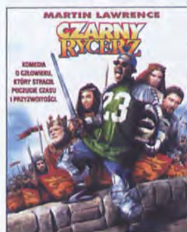
CZARNY RYCERZ reż. Gil Junger

ul. BOGUSŁAWSKIEGO 99, tel. 344 30 34, od 10.00-20.00, soboty 11.00-17.00