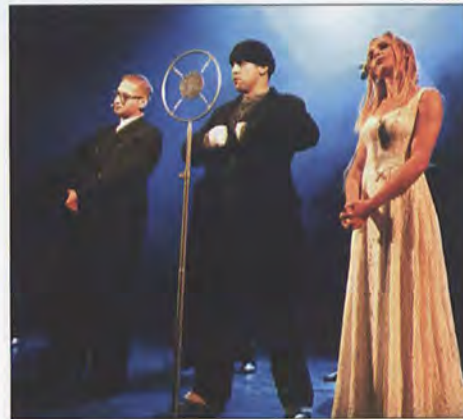
„Opera za trzy grosze”, reż. Wojciech Kościelniak Teatr Muzyczny Operetka Wroclawska 6-9 lutego