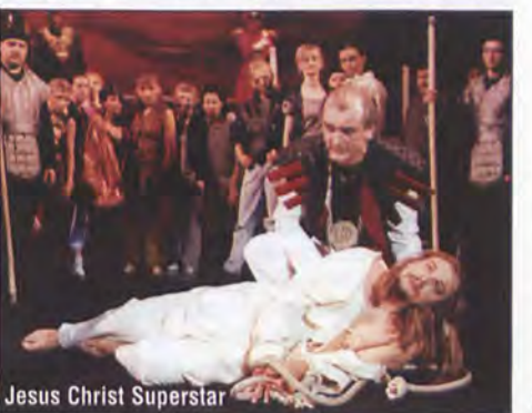
Jesus Christ Superstar

Próba, jak w każdej utopii, nie spełniona. Ale podjęta, w imię ludzkiej solidarności ponad podziałami – wszelkimi podziałami i wbrew wszelkim okolicznościom.