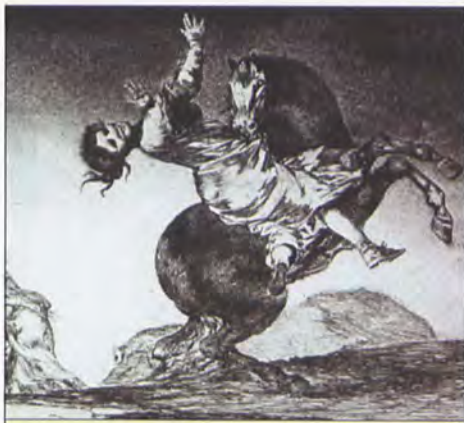
Francisco Goya - Grafiki

Wystawa czynna od 14 lutego w Muzeum Miedzi w Legnicy