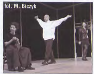
fol. M. Biczny