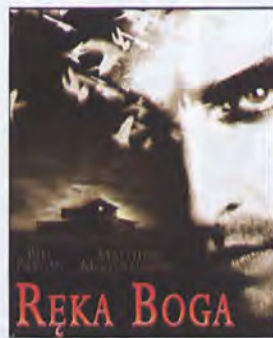
RĘKA BOGA reż. Bill Paxton

Jamal Walker pracuje w jednym z amerykańskich parków rozrywki, który oferuje swym gościom wyprawę w świat średniowiecza. Pewnego dnia Jamal wpada do zamkowej fosi i ku swemu zdumieniu przekonuje się, że trafił do... czternastowiecznej Anglii.