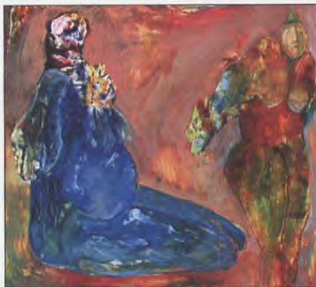
Wystawa malarstwa Katarzyny Szczyrbuły Galeria U Teresy, wernisaż 4 lutego, godz. 18.00 wystawa czynna do 28 lutego