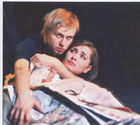
„Miłość i gniew” wg głośnego dramatu Johna Osborne'a, spektakl PWST na scenie Teatru k2 19-23 lutego

19 00 SONATA BELZEBUBA Stanisław I. Witkiewicz