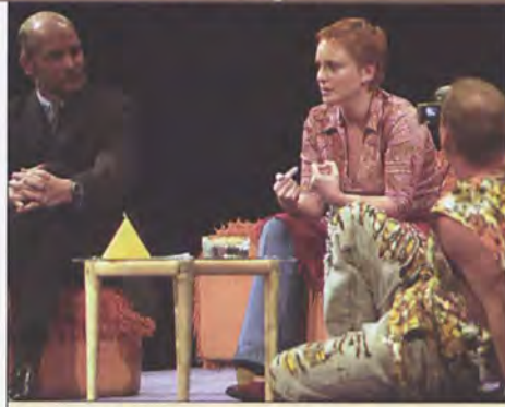
„Przypadek Klary”, reż. Paweł Miśkiewicz Teatr Polski - Duża Scena 1-2 i 19-21 lutego