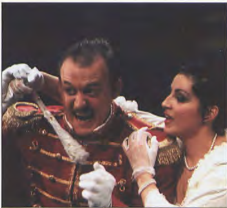
„Księżniczka czardasza”, reżyseria: Igor Przegrodzki, Teatr Muzyczny Operetka Wroclawska 14-15 lutego