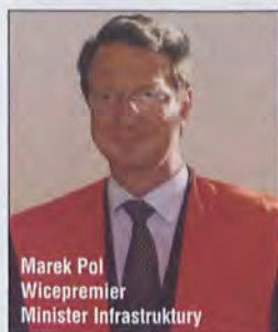
Marek Pol Wicepremier Minister Infrastruktury

LOŻA DOLNOŚLĄSKA Business Centre Club tel. 0602 195 552