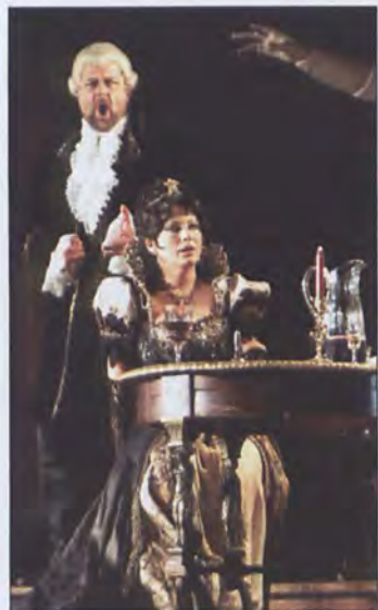
Giacomo Puccini TOSCA Libretto: G. Giacosa i L. Illica wg dramatu V. Sardou, (czas 2 godz. 30 min)

Tosca (1900) należy do najwybitniejszych przykładów operowego weryzmu. Pełna dramatycznego napięcia muzyka Pucciniego w mistrzowski sposób podkreśla i potęguje zawarte w treści dzieła kontrasty i przeciwieństwa: promienną radość życia i posępny cień zbliżającej się tragedii, pogodną atmosferę dworskiego balu i przejmującą scenę tortur. Postaci głównych bohaterów dają ich wykonawcom możliwość ukazania najwyższego kunsztu aktorskiego i wokalnego.