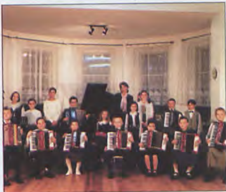
Koncert Orkiestry Dziecięcej HARMONIJKA i uczniów kursów muzycznych Agencji Koncertowej S-ART.