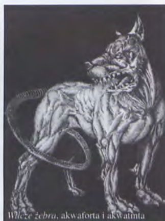
Włczy żebra, akwaforta i akwatinta