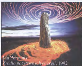
Jan Pohribny Zdroło pozwywanych energii, 1992

Galeria Szkła i Ceramiki ul. Kielbaśnicza 5 wystawa czynna do 23.06.