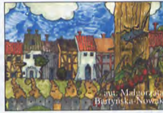
aut. Małgorzata Bartyńska-Nowak