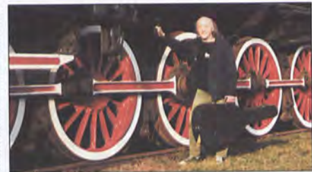
fol. K. Opalski

23.06., godz. 16.00 - Przywitanie gości godz. 16.15 - Konkursy i zabawy dla dzieci i młodzieży; godz. 17.00 - Występ Amatorskiego Ruchu Artystycznego z Wiązowa i okolic; godz. 18.15 - Zespół Odywk ; godz. 20.00 - Zespół Reagge ; godz. 22.00 - Zabawa plenerowa; 24.06., godz. 15.00 - Przywitanie gości, godz. 15.15 - Wystąpienie Burmistrza Miasta i Gminy Wiązów; godz. 15.30 - Wystąpienie Przewodniczącego Rady Miasta i Gminy Wiązów; godz. 15.45 - Koncert orkiestry dętej; godz. 16.30 - Występ zespołu Wiązowanie ; godz. 17.30 - Kabaret HiFi z Zielonej Góry; godz. 18.00 - Contra ; godz. 20.00 - Koncert zespołu Seventeen ; godz. 22.00 - Koncert zespołu The Postman ; godz. 0.00 - Pokaz sztucznych ogni; godz. 0.20 - Zabawa plenerowa Wiązowskie Centrum Kultury, pl. Wolności 22 57-120 Wiązów, tel./fax (071) 393 11 57, 393 10 58