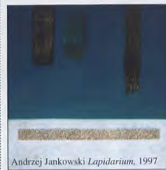
Andrzej Jankowski Lapidarium , 1997

DSAFiTA zaprasza do udziału w III Międzynarodowym Fotomaratonie-Wrocław, Wrzesień, Start w Nowe Milenium-II 2001 - 7-9.09. Stowarzyszenie przedłużyło składanie prac fotograficznych, w ogłoszonych w ramach I Międzynarodowego Festiwalu Fotografii 2001, konkursach fotograficznych – do 1.09. Zapisy i informacje: sekretariat DSAFiA, tel. 344 57 92.