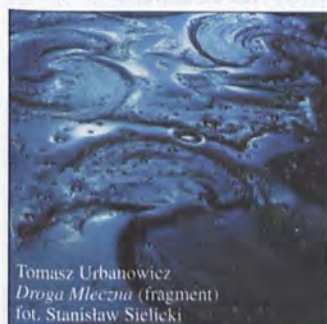
Tomasz Urbanowicz Droga Mleczna (fragment)

Galeria Awangarda ul. Wita Stwosza 32 wystawa czynna do 10.06.