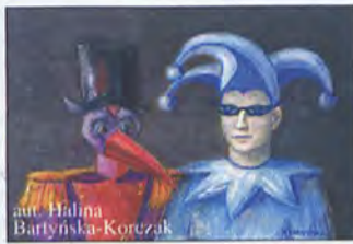
aut. Halina Bartyńska-Korczak

Galeria Sztuki Współczesnej Krystyny Kowalskiej, ul. Jatki 12-15 wernisaż 23.06., godz. 14.00 wystawa czynna od 23.06 do 20.07.