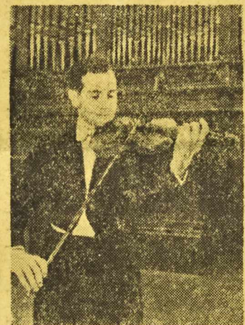
Na zdjęciu: Igor Ojstrach (ZSRR) i nagroda.

LAUREACI II MIĘDZYNARODOWEGO KONKURSU SKRZYPCOWEGO IM. H. WIENIAWSKIEGO