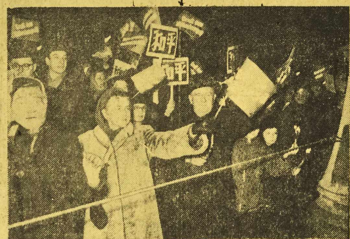
KONGRES NARODÓW W OBRONIE POKOJU W WIEDNIU