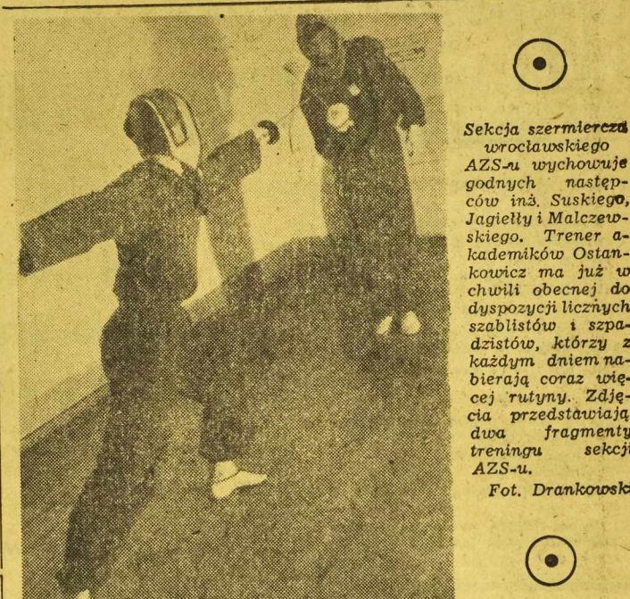
Sekcja szermiercza wrocławskiego AZS-u wychowuje godnych następców inż. Suskiego, Jagielly i Malczewskiego. Trener akademików Ostanowicz ma już w chwili obecnej do dyspozycji licznych szablistów i szpadzistów, którzy z każdym dniem nabierają coraz większej rutyny. Zdjęcia przedstawiają dwa fragmenty treningu sekcji AZS-u.

W konkurencji kobiet w klasyfikacji indywidualnej na pierwszym miejscu jest Świerzy (Polska) — 19,20, przed Rakoczy (Polska) — 19,15, i Perim (Rumunia) — 18,45. Dalsze miejsca zajmują Horzonek (Polska) — 18,42, Goeliner (Rumunia) — 18,35 i Kurzanka (Polska) — 18,25.