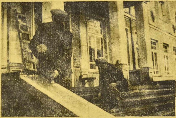
PRZEBUDOWA DOMU MARYNARZA W GDYNI

sezonie zobaczymy odrzańskie jednostki rzeczne w nowej szacie.