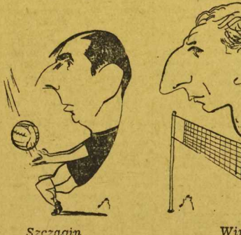
Szczagin Winer Gailit

REWANŻOWE spotkanie piłkarzy Ostrawy i Górnik przyniosło zwycięstwo Czechosłowakom 2:1 (1:1). Do przerwy gra była równorzędna.