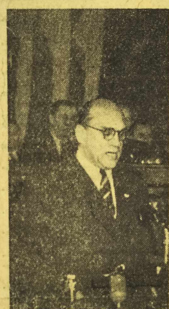
II OGÓLNOPOLSKI KONGRES OBRONCÓW POKOJU

W DNIU 30 listopada br. w Warszawie, w sali Rady Państwa rozpoczął obrady II Ogólnopolski Kongres Obrońców Pokoju. Na zdjęciu: Literat Jarosław Iwaszkiewicz wygłasza referat „Aktualne zadania polskiego ruchu obrońców pokoju”.