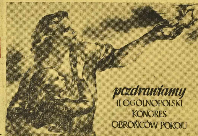
pozdrawiamy II OGÓLNOPOLSKI KONGRES OBRONCÓW POKOJU

Również jednymyślnie uchwalili zebrani despesz do uczestników