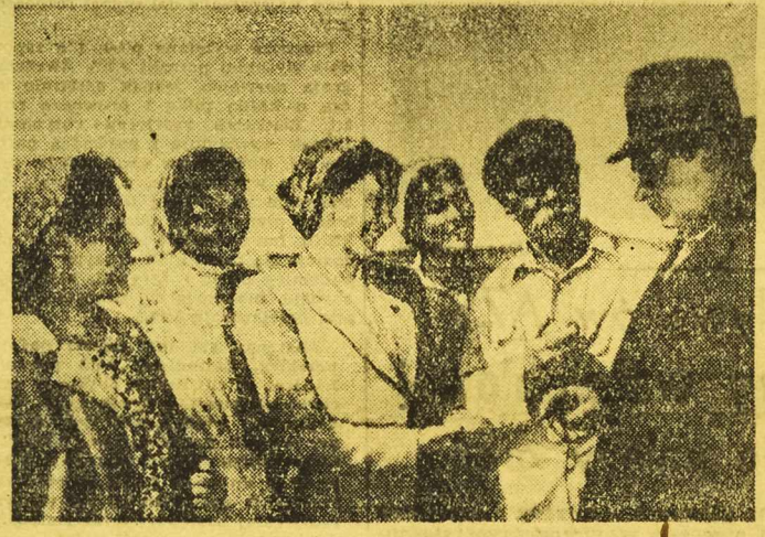
Zdjęcie konkursowe nr 7