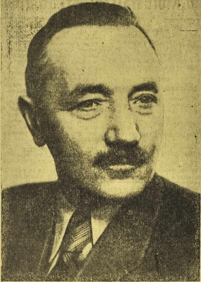
PRZEWODNICZĄCY KC PZPR BOLESŁAW BIERUT WYGŁOSIŁ WCZORAJ NA NARADZIE AKTYWU PARTYJNEGO W WARSZAWIE PRZEMÓWIENIE, KTÓREGO TEKST PODAJEMY NA STRONIE 3. NA STRONIE 4 ZAMIESZCZAMY ARTYKUŁ PREZYDENTA BIERUTA, OPUBLIKOWANY OSTATNIO W „PRAWDZIE”.