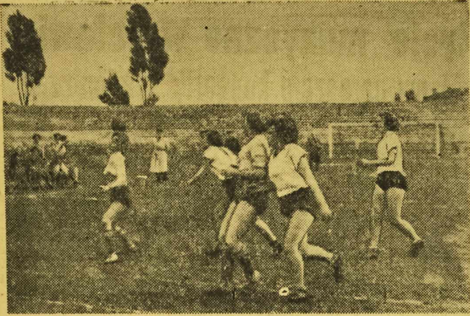
UNIA Łódź w meczu finałowym o mistrzostwo Polski w piłce ręcznej pokonała Budowlanych z Chorzowa 6:3. Na zdjęciu: fragment spotkania.