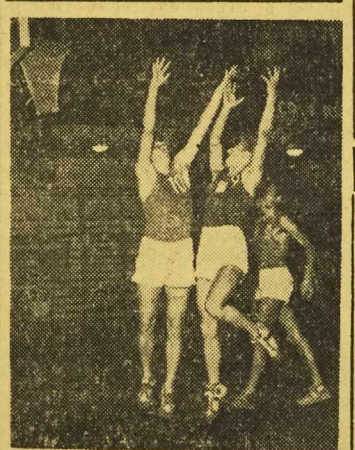
W Łodzi odbył się turniej koszykówki z udziałem Włókniarza, Ogniw, Spójni i AZSu. Na zdjęciu: fragment spotkania AZS — Włókniarz, które zakończyło się zwycięstwem Włókniarza.

Najlepszy czas osiągnęła drużyna I Szkoły Ogólnokształcącej, która dystans 5.000 m przebiegła w 24 minuty. Studenti wyższych uczelni oprócz Politechniki wystartowali w trzech różnych punktach miasta, lecz wszystkie grupy miały swój koń