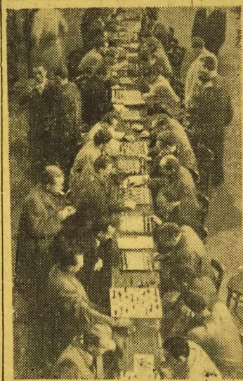
Na zdjęciu: uczestnicy turnieju rozgrywanego przez pierwsze partie.

I tak się zaczęło. Biorąc pistolet do ręki na pewno nie przypuszczałem, że będzie to mój debiut w roli startera i że funkcję tę pełnić będę przez 25 lat.