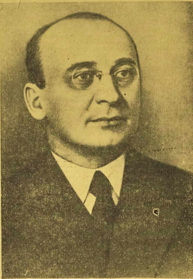
W obu Pięciolatkach łącznie. (Okłaski). W samym zaś tylko 1952 roku w takich niezwykłe ważne dziedziny produkcji przemysłowej, jak energia elektryczna, metale żelazne, węgiel, produkty naftowe, cement oraz produkcja przedmiotów masowego spożycia, wyprodukujemy o wiele więcej niż przez cały okres pierwszej Pięciolatki.

W wojnie tej decydowały się losy naszej ojczyzny oraz losy państw i narodów Europy i Azji. Jasne jest dla każdego, że gdyby koalicja hitlerowska odniosła zwycięstwo, doprowadziłoby to do potwornego ujarznienia i wyniszczenia narodów naszego kraju i narodów wielu innych krajów. Setki milionów ludzi znalazłoby się w sytuacji niewolników. Barbarzyńcy faszystowskie zniszczyłyby wspólną cywilizację i odrzuciliby całą ludzkość o wiele dziesięcioleci wstecz.