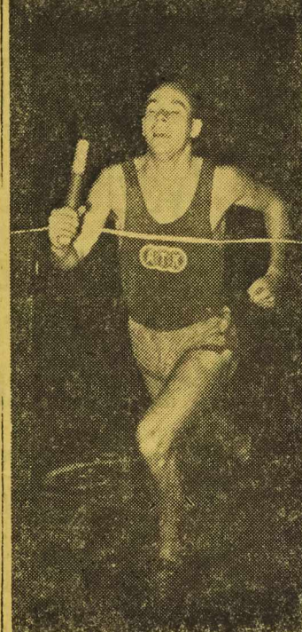
Rozegrane w dniach 27—28 września w Warszawie międzynarodowe spotkanie lekkoatletyczne pomiędzy ATK i CWKS zakończone zostało zwycięstwem reprezentacji Armii Czechosłowackiej w stosunku 250,5 : 192,5 pkt. Na zdjęciu: Na mecie sztafety 4x400 m zakończonej zwycięstwem ATK w czasie 3:20,0.

„Byłem już w wielu krajach, w wielu miastach, ale nigdy jeszcze nie przygotowywałem się do wyjazdu z tak wielkim radosnym podnieceniem. Do Moskwy przybyliśmy wieczorem. Na lotnisku ocze-