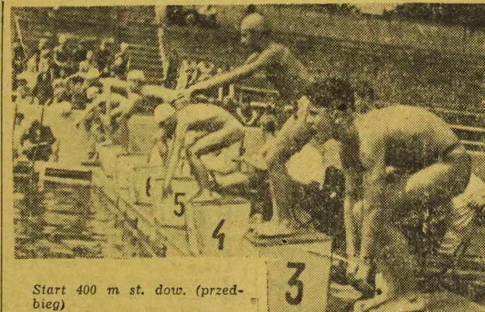
Start 400 m st. dow. (przedbieg)

SIATKÓWKA MĘSKA: Godz. 9 i 16 spotkania o miejsca od 5-8 i od 1-4.