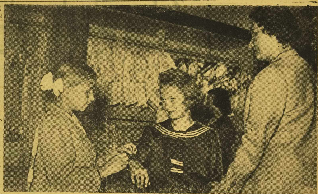
PRZED NOWYM ROKIEM SZKOLNYM

Dlatego też przyłącza się on do propozycji rządu radzieckiego w sprawie zwołania w najbliższym czasie, najpóźniej w październiku, konferencji czterech mocarstw, na której powinny być omówione i rozwiązane, z udziałem przedstawicieli NRD i Zachodnio-Niemieckiej Republiki Związkowej, te żywotne zagadnienia narodu niemieckiego.