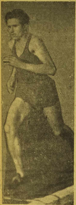
GRAJ z warszawskiej Gwardii jest najpoważniejszym kandydatem do tytułu mistrzowskiego na 5.000 m.

O D KILKU dni Wrocław żyje pod wrażeniem lekkoatletycznych mistrzostw Polski, które rozpoczęły się w dniu wczorajszym na stadionie Gwardii. Mimo to w godzinach popołudniowych na otwarciu mistrzostw była obecna zaledwie niewielka liczba widzów.