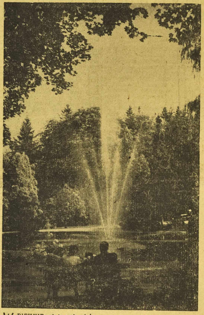
W PIĘKNIE położonych miejscowościach wczasowych i uzdrowiskach wypoczywają nabierając siły i zdrowia, ludzie pracy z całego kraju. Na zdjęciu: fragment parku w Polanicy Zdroju.

NIEDZIELA 26 października będzie wielkim dniem w życiu naszego narodu. W miastach i wsiach miliony Polaków pójdą w tę niedzielę do urn aby dokonać wyboru najwyższego przedstawicielstwa polskiego narodu, aby wybrać najwyższą władzę — Sejm Polskiej Rzeczypospolitej Ludowej. Po raz pierwszy w naszej historii głosować będzie młodzież od 18-go roku życia. Wojskowi będą głosować na równi z osobami cywilnymi. Kobiety na równi z mężczyznami. Demokratyczna ordynacja wyborcza spełnia bowiem w pełni zasadę równości i powszechności wyborów. Spełnia zasadę bezpośredniości głosowania, zapewniając wyborcy prawo oddania głosu nie tylko na listę ale i na konkretnych ludzi, na kandydatów znanych mu z imienia i nazwiska. Przy tym wyborca ma prawo skreślić z listy poszczególnych kandydatów na posłów lub zastępców. Każdy kandydat musi uzyskać bezwzględną większość głosów, aby mógł zostać posłem. Szczegółowe przepisy gwarantują w pełni tajność głosowania. Tak więc nasza ordynacja wyborcza przeniknięta jest duchem głębokiego demokratyzmu, z którego wyzbyte są wszelkie ordynacje wyborcze w krajach kapitalistycznych. (Dalszy ciąg na str. 2) B