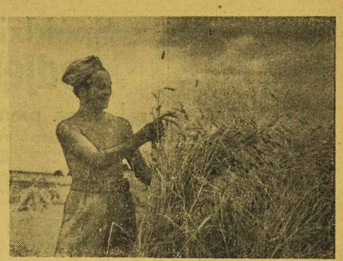
BRYGADY SP. POMAGAJĄ W ŻNIWACH

Rok VII. Nr 190 (1990) Dziś 4 strony. Wydanie ABC Cena 15 groszy Sabota, dnia 9 sierpnia 1952 r.