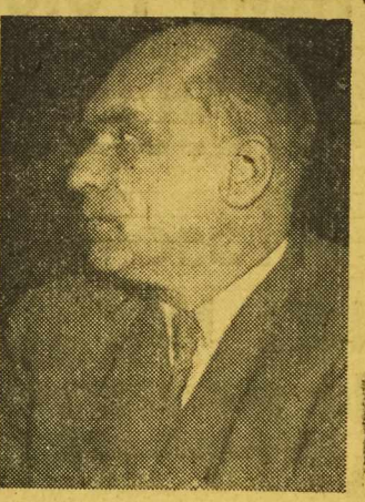
NA ZDJĘCIU: Jarosław Iwaszkiewicz — laureat nagrody I stopnia za wybitne zasługi twórcze w literaturze polskiej.

„Podczas, gdy imperia- lści USA zamieniają uro- dzajne ziemie, ogrody i pola w pustynie — ludzie ra- dzieccy tworzą sztuczne morza i kanały, przynoszące bogactwo i dobrobyt”