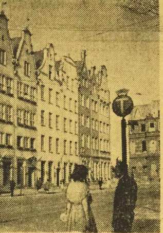
NA ZDJĘCIU: odbudowane zabytkowe kamieniczki Gdańska.