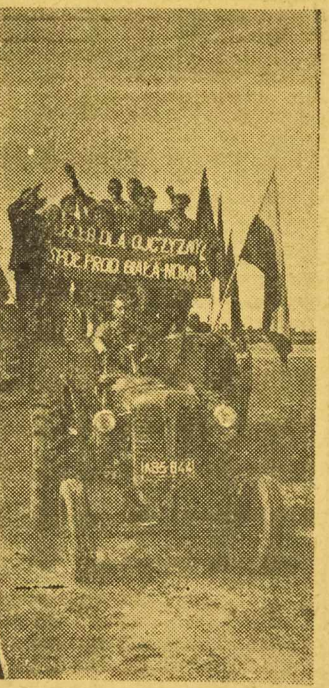
SPOŁDZIELCY z Białej Nowej w woj. warszawskim bezpośrednio po omotach odstawiają zboże do punktu skupu w Płocku.