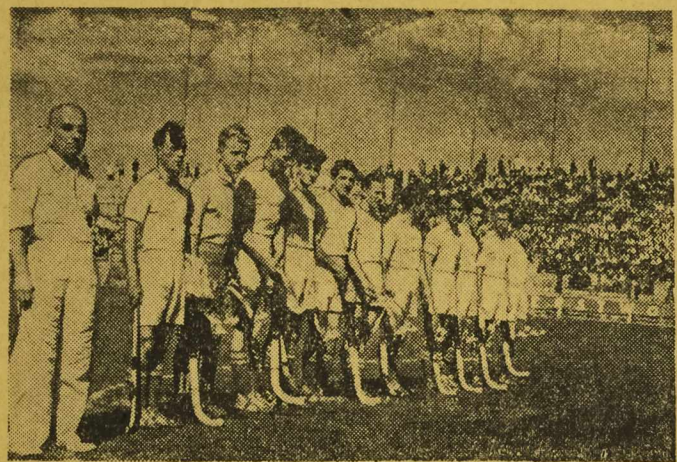
HOKEISCI polscy na trawie pojechali na Igrzyska Olimpijskie do Helsinek. Przed opuszczeniem kraju rozegrali oni treningowe spotkanie z wiedeńskim zespołem AHC. Na zdjęciu: drużyna olimpijska występująca pod nazwą Spójni, która pokonała wiedeńczyków 9:1.