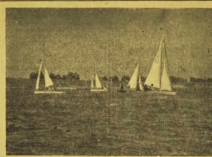
W niedzielę, dnia 15 czerwca br. na trasie Góra Kalwarii — Warszawa, rozegrano regaty żeglarskie o nagrodę przechodnią ZS „Gwardia”. W regatach wzięło udział ponad 120 różnych jednostek wodnych. Pierwsze miejsce i nagrodę przechodnią zdobyli żeglarze stołecznego Kolejarza, uzyskując największą ilość punktowanych miejsc w poszczególnych klasach. Na zdjęciu: Grupa żaglówek na trasie regat.

Oboz w Lebie potrwa do lipca. Zawodnicy będą tam mieli doskonałe warunki do treningu i powinni przebywać tam jak najdłużej.