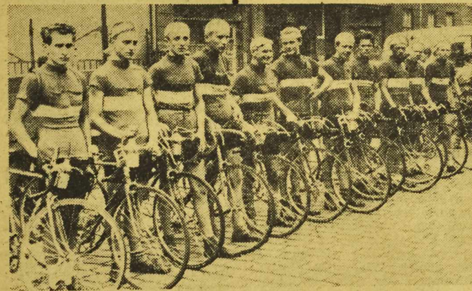
Sekcja kolarska wrocławskiej Gwardii

W meczu piłkarskim o puchar „Gwardii” Bydgoszcz zwyciężyła Łódź 2:1 (1:0, 1:1) po dogrywce.