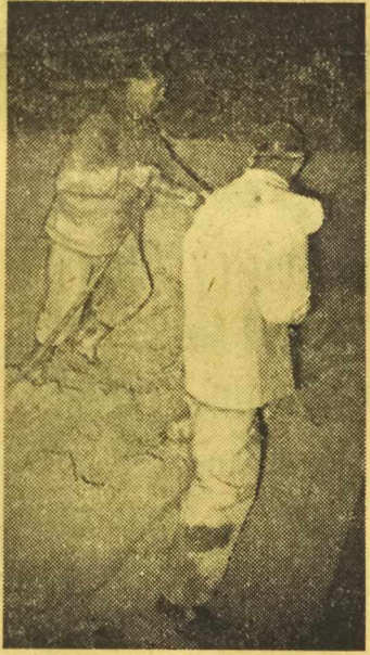
Prace przy budowie metra warszawskiego postępują w prawdziwie warszawskim tempie naprzód.

D NIA 16 bm. załogi trzech wielkich zakładów przemysłowych: Zakładów Mechanicznych „Ursus“, huty im. Feliksa Dzierżyńskiego i kopalni „Siemianowice“ podczas uroczystych zebrań załogowych rzuciły wezwanie do ludzi pracy całej Polski o przystępowanie do zobowiązaniowego współzawodnictwa pracy dla uczczenia święta 22 Lipca — ósmej rocznicy Manifestu PKWN.