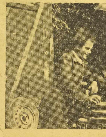
(Dokończenie na str. 2). A

SFZZ apeluje do mas pracujących całego świata, zwłaszcza w tych krajach, gdzie projekt militarystycznego „układu ogólnego“ przedłożony zostanie do ratyfikacji, aby rozwinęły aktywną kampanię protestacyjną i zażądały likwidacji tego układu.