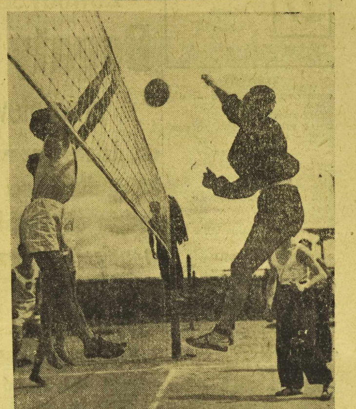
Siatkarze warszawscy rozgrywa-li spotkania w ramach mistrzostw kół sportowych stolicy. Na zdjęciu: fragment spotkania między drużynami Wojskowej Akademii Technicznej i AZS (SG GW).

Kobiety: 60 m Orsztynowicz (Bydg) - 8,0 sek. Skok w dal: Orsztynowicz (Bydg) 4,80 m.