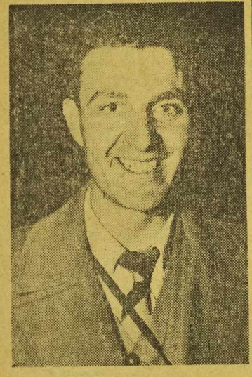
Steel (Anglia) zwycięzca Wyścigu Pokoju Warszawa - Berlin - Praga

PROGRAM na 15 MAJA BR. 5.00 Pocz. aud. 5.05 Wiadomości 5.10 Aud. dla wsi. 5.20 Koncert 5.38 Sygnał czasu 6.00 Stan pogody 6.05 Gimnastyka 6.15 Muzyka 6.25 Dziś w Gazecie Robotniczej 6.30 Dziennik 6.50 Styliz. muzyka 7.20 Pięćni 7.50 Kalendarz 7.55 Wiadomości 11.45 Głos mają kobiety. 11.52 Nowa Huta - pięść 11.57 Sygnał i hejnał 12.04 Dziennik 12.15 Muzyka 12.30 Aud. dla wsi 12.45 Na swojską nutę 13.15 Aud. wiejska 13.25 Program 13.30 Wszelchnia 13.45 Muzyka 14.30 Koncert 15.10 Przy dochod. śledczy 15.25 Muzyka 15.30 Aud. dla świetlic dzieci. 16.00 Wszelchnia 16.20 Program 16.25 Muzyka 16.40 Z miasta i wsi Dł. Si. 17.00 Wiadomości. 17.10 Stojewski. 17.45 Aud. literacka 18.00 Koncert 18.30 Wszelchnia 18.50 Aud. sportowa 19.00 Koncert 19.20 Reportaż 19.30 Muzyk. i aktualności 19.59 Stan pogody 20.00 Dziennik 20.25 Wiadom. sportowe 20.30 Koncert 20.50 Aud. społeczno - oświatowa 21.00 Aud. w jez. obcych 22.20 Muzyka. 23.00 Wiadomości. 23.10 Hymn.