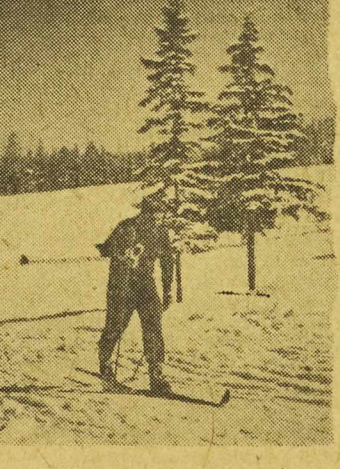
Z narciarskich mistrzostw Polski w Zakopanem.