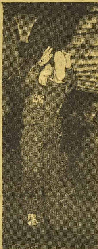
DRUŻYNA radzieckich lekkoatletów udająca się na tradycyjny bieg na przelaj, zorganizowany przez redakcję „Humanite” przebywa w Warszawie.