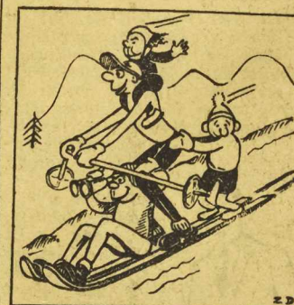
Narciarz z rodziną na wczasach