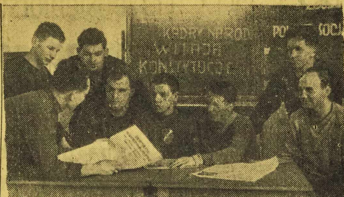
Projekt Konstytucji Polskiej Rzeczypospolitej Ludowej zapewni szeroki rozwój sportu. W całym kraju sportowcy szeroko omawiają projekt Konstytucji, wyrażając przy tym wdzięczność państwu za wszechstronną opiekę.

200 m klas. kobiet: 1. Stąporkówna Og. 3,18,5 2. Herbaczenko Og. 3,30,9 3. Geinerówna Gw. 3,42,8