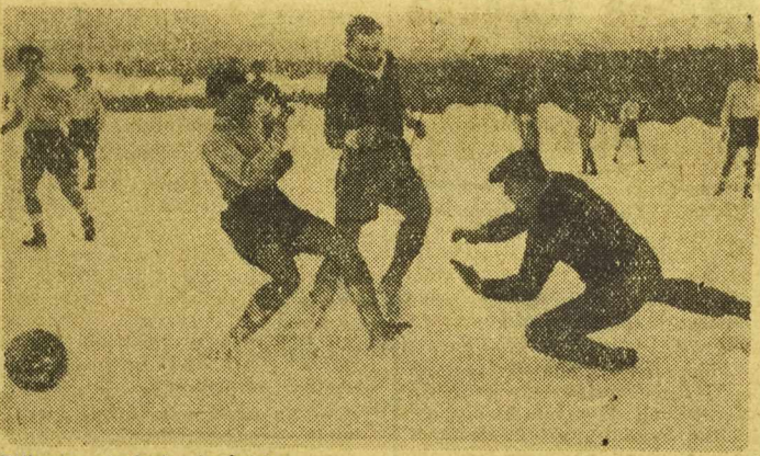
Pilkarze nie boją się śniegu. Na zdjęciu możemy zaobserwować śmiałe poczynania na ośnieżonym boisku piłkarzy Gwardii Kraków i Unii Chorzów. Spotkanie to zakończyło się wygrana Unii 3:0.