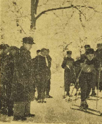
Młodzież szkolna korzystając z pięknej zimowej pogody urządza coraz częściej zawody narciarskie. Na zdjęciu start do biegu parolowego, podczas imprezy zorganizowanej przez warszawskich harcerzy

W dziesiątce wojskowych walczyć będą między innymi: Piasecki, Sobkowiak, Dylak, Grymlin, Malczyk, Beśka i Wieczorek. (Bil)