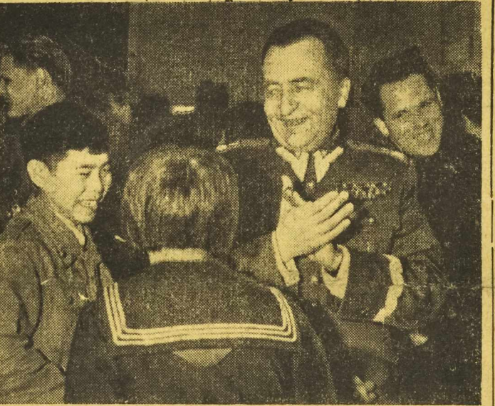
WIECZORNICA MŁODZIEŻY W WISŁE—GLEBCACH

W ZGROMADZENIU Narodowym toczyła się wczoraj w dalszym ciągu debata w sprawie projektu utworzenia t.zw. „armii europejskiej” i remilitaryzacji Niemiec zachodnich. Podczas debaty nawet postawie prawicowi zmuszeni byli pod niebyszym naciskiem opinii publicznej wysuwać w swych przemówieniach zastrzeżenia wobec planu utworzenia „armii europejskiej”, który ma być szyldem, osłaniającym remilitaryzację Niemiec zachodnich.