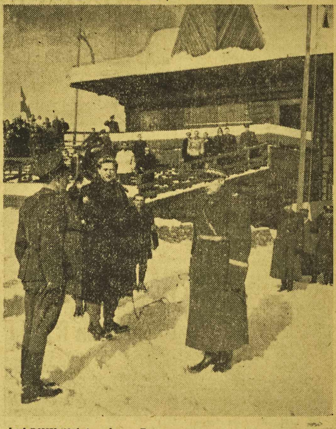
W DNIU 10 lutego br. w Zakopanem rozpoczęła się II Spartakiada Zimowa Wojska Polskiego. Na uroczystość otwarcia przybył minister Obrony Narodowej Marszałek Polski Konstanty Rokossowski w towarzystwie wiceministra Obrony Narodowej gen. broni Popławskiego. — Na zdjęciu: Marszałek Polski Konstanty Rokossowski przyjmuje raport od oficera Rzepkowskiego.

13 LUTEGO przypada 7-rocznica wyzwolenia Budapesztu przez Armię Radziecką. W ciągu siedmiu lat od pamiętnej daty 13. II. 1945 roku w stolicy Węgier odbudowano 79.000 mieszkań zniszczonych w czasie wojny i 4,5 miliona metrów kwadr. powierzchni dachów, odbudowano także wysadzone mosty. W ramach Planu 5-letniego tj. do 1954 r. mieszkańcy Budapesztu otrzymają ponad 10.000 mieszkań. Na zdjęciu: Odbudowany most łańcuchowy na Dunaju, łączący śródmieście z przedmieściami Budy, który został wysadzony w powietrze przez Niemców w czasie wojny. (Dokończenie na str. 2-ej)