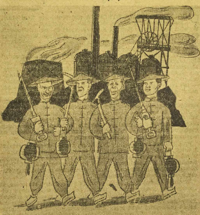
Markiewka, Sierny, Apryas, Kawczyk

Belgijski mln. spraw zagranicznych Van Zeeland puścił w świat kłamliwą wiadomość, że w polskich kopalniach pracuje 500.000 Chinczyków.