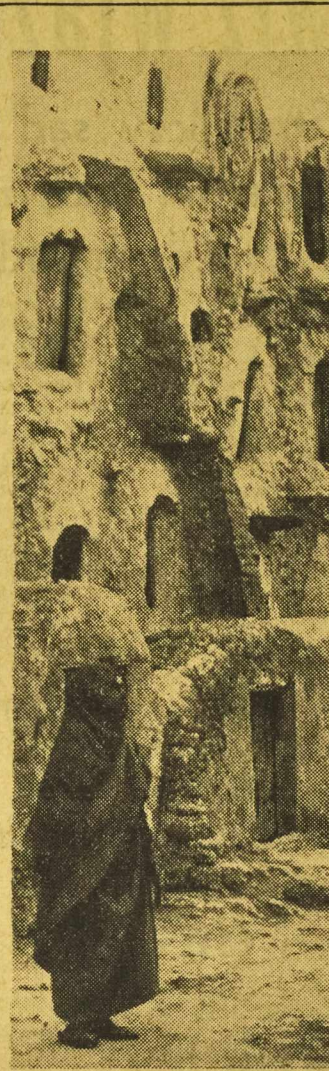
Jak ludzie jaskiniowi, w norach wydrążonych w skałach mieszka ludność Tunisu pod rządami kolonistów francuskich.

Z WYCZAJNA sesja Zgromadzenia Ogólnego ONZ w Paryżu, rozpoczęła się 6 listopada 1951 r. zakończyła się we wtorek, 5 lutego br. po południu. Na końcowym posiedzeniu przemawiało kilku delegatów, którzy podziękowali Francji za gościnność. Zabrał m. in. głos delegat radziecki Malik. Wreszcie przemawiał sekretarz generalny ONZ Trygwe Lie i przewodniczący Zgromadzenia — Neruo.