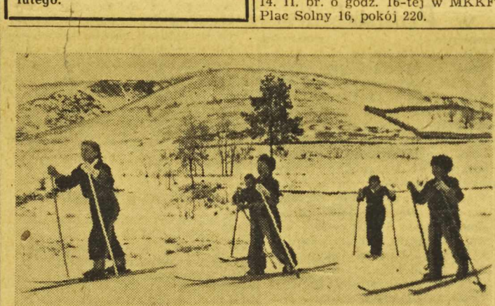
W Związku Radzieckim uprawianie sportu jest zjawiskiem powszechnym. Na zdjęciu: Uczniowie jednej ze szkół wiejskich na nartach.

WŁADZE sportowe Czechosłowacji potwierdziły już przyjazd reprezentacji bokserkiej do Polski. Pierwszy mecz odbędzie się we Wrocławiu 14 lutego, a drugi w Szczecinie w dniu 20 lutego.