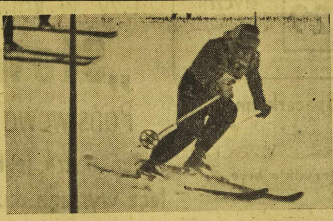
Z eliminacji kadry narciarskiej w slalomie.