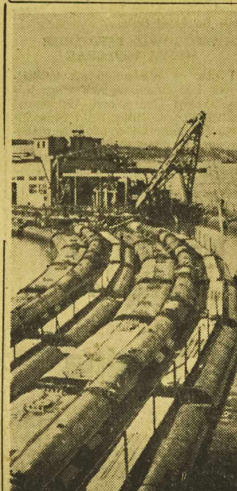
Związek Radziecki posiada najpotężniejsze maszyny świata. Pneumatyczne pompy ziemne konstrukcji radzieckiej nie posiadają sobie równych na całej kuli ziemskiej. — Na zdjęciu: Próba pneumatycznej pompy „Stalingradzki 2”.

W ZURICHU na posiedzeniu międzynarodowej federacji hokeja na lodzie dokonano losowania gier olimpijskiego turnieju hokejowego w Cslu. Polska wylosowała przeciwników według następującej kolejności: 15 lutego — z Czechosłowacją, 16 lutego — ze Szwecją, 17 lutego — ze Szwajcarią, 18 lutego — z Kanadą, 20 lutego — z Niemcami zach., 22 lutego — z USA, 23 lutego — z Finlandią, 24 lutego — z Norwegią.