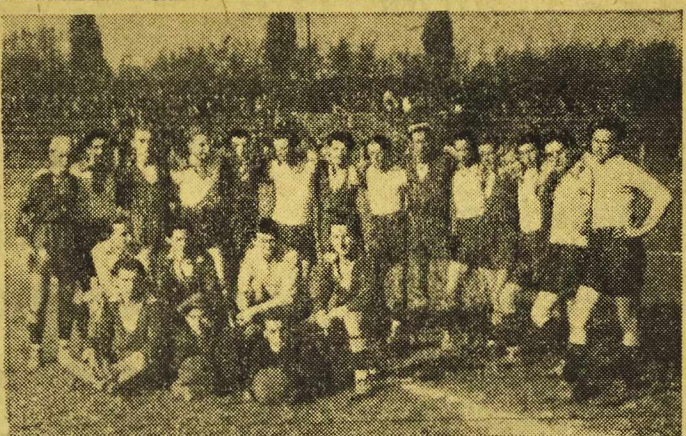
Drużyna SKS-ów przy szkołach felcerskich przeprowadziły zawody piłkarskie o mistrzostwo okręgu szkół felcerskich. Na zdjęciu drużyny: z Kłodzka (w białych koszulkach) i Wrocławia.

W pierwszej rundzie odbędą się następujące spotkania: Ognio Wr. — Stal Psie Pole, Stal Wr. — Kolejarz Wr., Włókniarz Dzierżoniów — OWKS Wr.