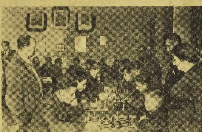
Turniej szachowy juniorów Legnicy wzbudził duże zainteresowanie. Nieraz można na sali spotkać rodziców przyszłych mistrzów.