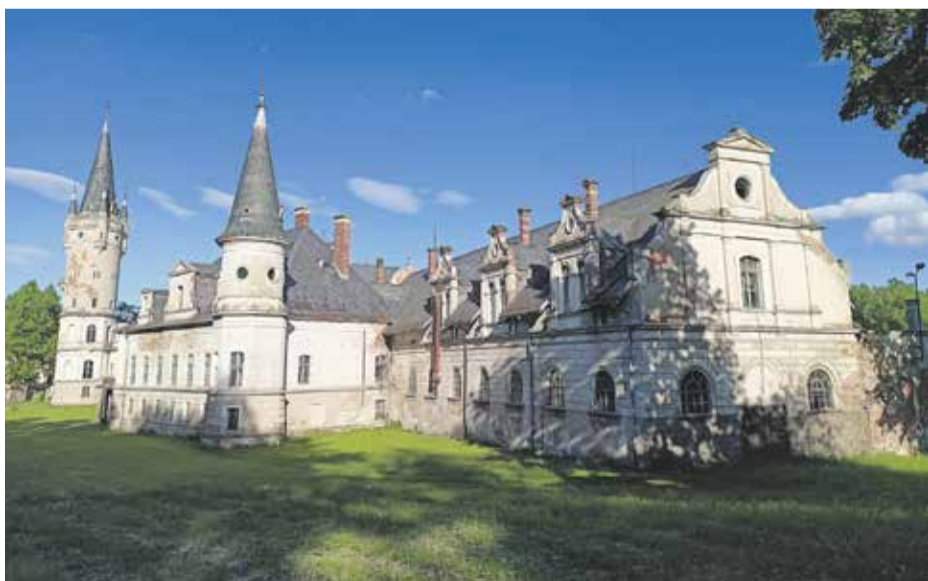
Pałac w Bożkowie