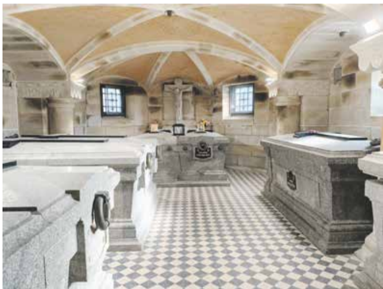
Oldřichowice Kłodzkie, sarkofagi w mauzoleum

sarży Maksymiliana II i Rudolfa II przeniósł się do Pragi w roku 1588, zaś jego synowie otrzymali tytuł baronowski, a wkrótce – hrabiów Rzeszy. Dwie linie rodu nabywały przez lata posiadłości na Morawach i na terenie hrabstwa kłodzkiego. W roku 1780 von Magnisowie zo-