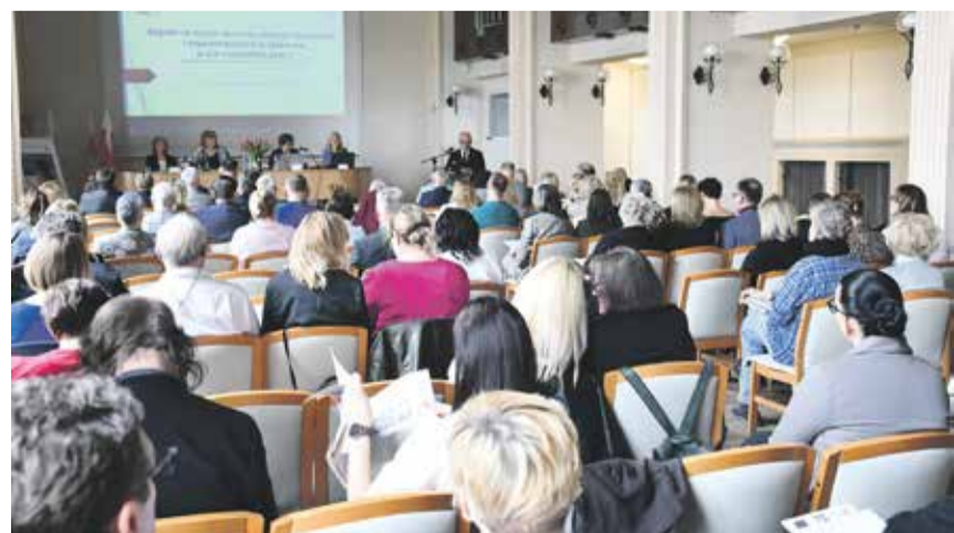
Sala obrad gdańskiego Akwenu zapelnila się po brzegi