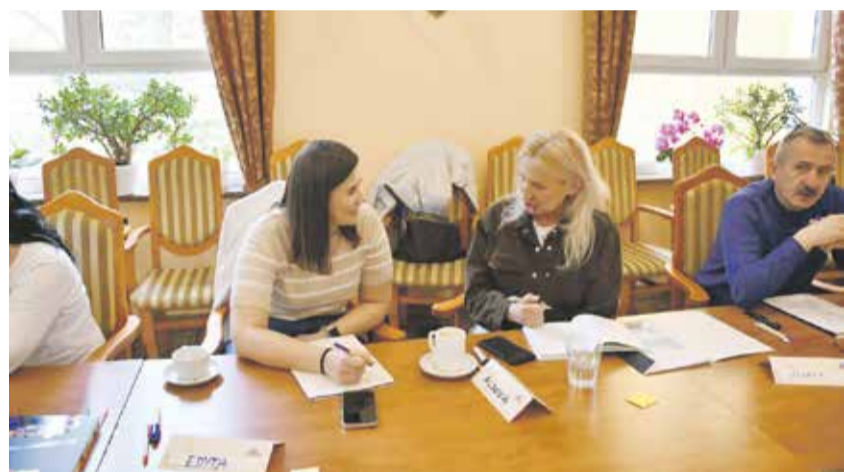
W trakcie szkolenia