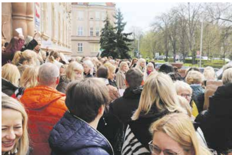
Kilkaset pracowników oddziału ZUS przy ul. Pretficza we Wrocławiu

Ośrodek Szkolenia Państwowej Inspekcji Pracy we Wrocławiu przy ul. M. Kopernika 5