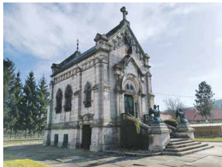
Mauzoleum von Magnisów w Oldřichowicach Kłodzkich