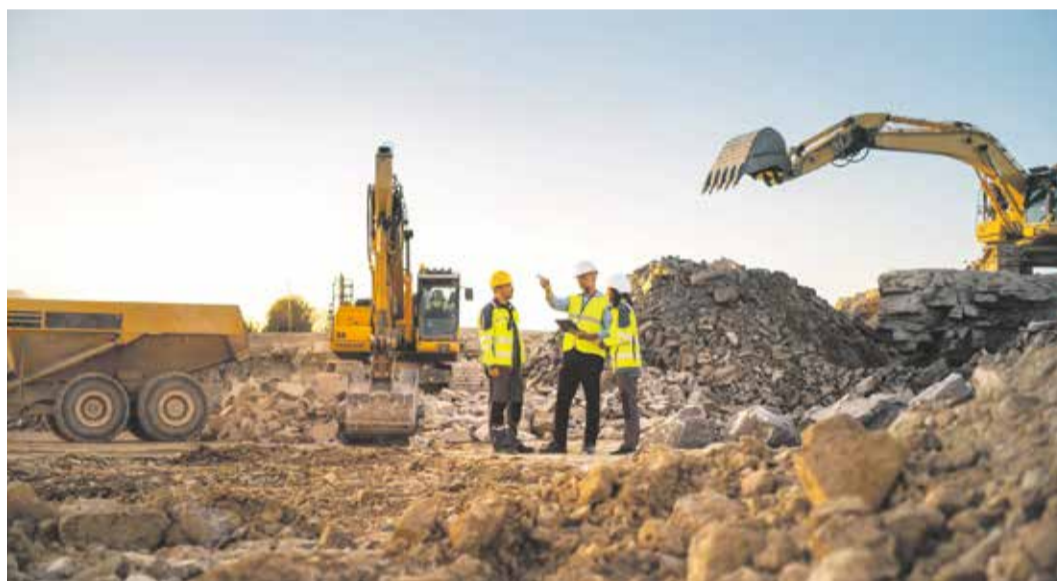
Implementacja unijnej dyrektywy przyczyni się do większej przejrzystości kształtowania wynagrodzeń

pracodawca ustala je w uzgodnieniu z organizacjami reprezentatywnymi w rozumieniu art. 25 3 ust. 1 lub 2 ustawy z dnia 23 maja 1991 r. o związkach zawodowych, z których każda zrzesza co najmniej 5% pracowników zatrudnionych u pracodawcy. Na podstawie „kryteriów i podkryteriów” pracodawca ustalać będzie „kategorie pracowników”, co na gruncie ustawy oznaczać ma pracowników wykonujących jednakową pracę lub pracę o jednakowej wartości, pogrupowanych przez pracodawcę w sposób niearbitralny, na podstawie niedyskryminacyjnych