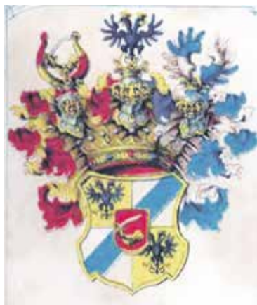
Herb rodu von Magnis

stali zaliczeni w poczet szlachty pruskiej. Należały do nich Wambierzyce, Nowa Ruda, Wojborze, Ścinawka Średnia i Dolna, Raszków, Czerwieńczyce, Oldřichowice Kłodzkie, Bożków i jeszcze kilka miejscowości. Byli wojskowymi, właścicielami ziemskimi, duchownymi, mecenasami sztuki, przemysłowcami, posłami do Reichstagu i – jak w przeszłości – kupcami. Pozostawili po sobie rezydencje i miejsca spoczynku – niezwykle podziwiać. Rodowych siedzib, jako się rzekło, mieli sporo. Na ziemi kłodzkiej jednak najważniejsze z nich to Oldřichowice Kłodzkie i Bożków. Oldřichowice to wieś, o której pierwsza wzmianka pochodzi z wieku XIV. Powstały na tzw.