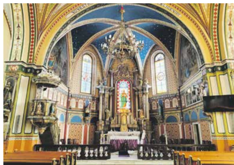
Oldřichowice Kłodzkie, kościół pw. św. Jana Chciciela