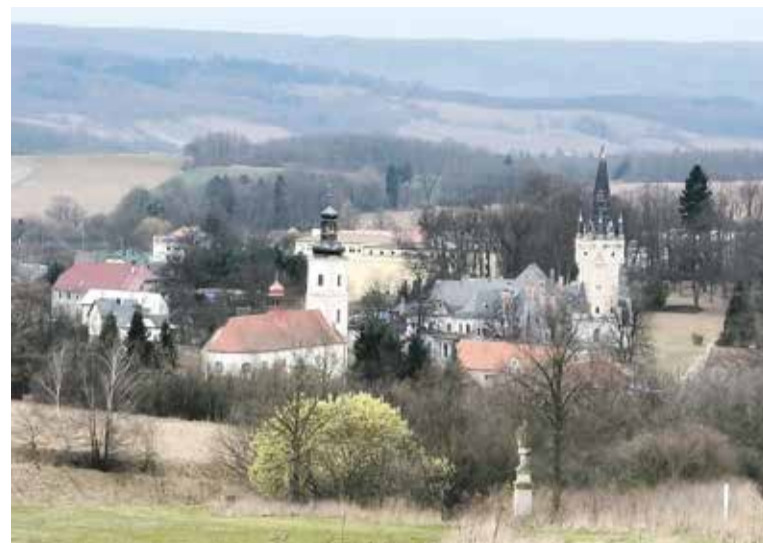
Bożków – pałac i kościół