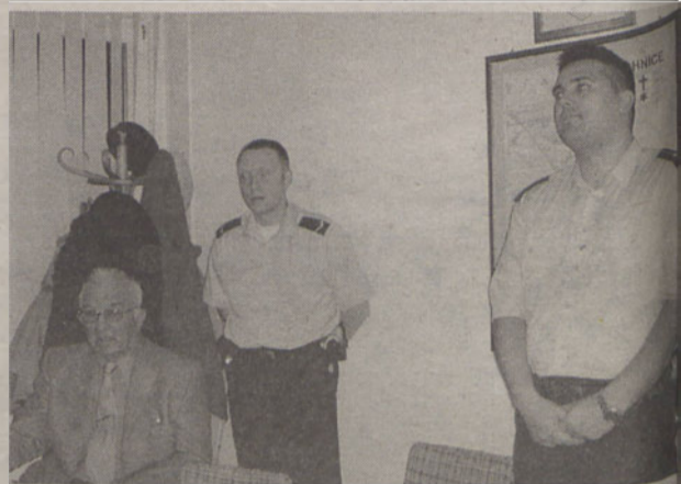
Policjanci mają na terenie gminy coraz więcej obowiązków

Na terenie gminy Święta Katarzyna pracuje obecnie czterech policjantów: kierownik posterunku i trzech dzielnicowych. Coraz bardziej potrzebują oni wsparcia ze strony straży gminnej.