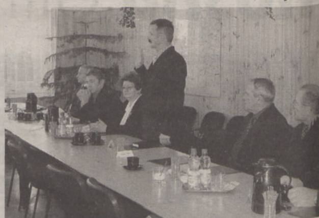
Podczas sesji radni złożyli uroczyste ślubowanie

27 listopada odbyła się pierwsza po wyborach samorządowych sesja Rady Miejskiej Kątów Wrocławskich.