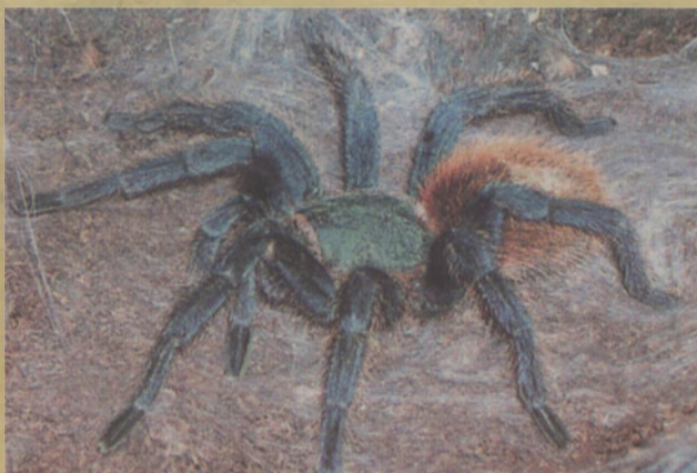
Piękne ubarwienie ptasznika