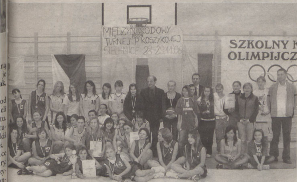
Międzynarodowy turniej piłki koszykowej dziewcząt

Techniczne gimnazjum po raz pierwszy zorganizowało międzynarodowy turniej piłki koszykowej dziewcząt i chłopców. W kategorii dziewcząt bezkonkurencyjne okazały się zawodniczki z przyjaźnionego Javornika w kategorii chłopców historyczne zwycięstwo przyniósł uczniowie z Kamieńca Wrocławskiego.