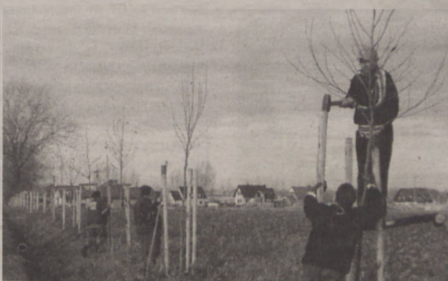
Sadzenie platanów przy drodze

Wrocławskie zobowiązała się do pielęgnowania i utrzymania drzew.