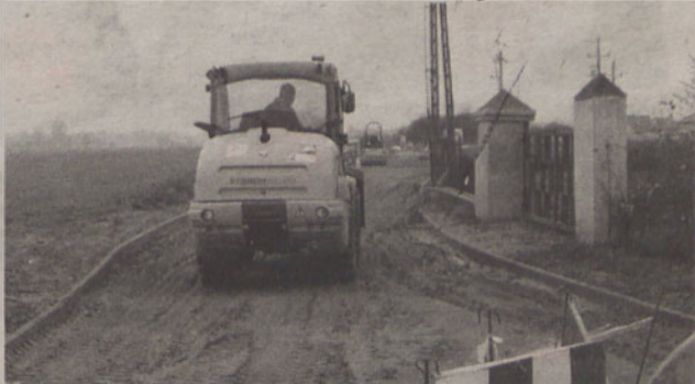
W listopadzie zakończone zostały prace modernizacyjne na wielu gminnych drogach. Do końca roku potrwa jeszcze realizacja kilku zadań, między innymi w obrębie ulic Południowej, Sezamkowej, Bocznej i Wschodniej w Kielczowie. E.M.