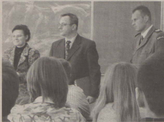
Pierwsze spotkanie trójek klasowych zaczęło od gimnazjum w Czernicy

W szkołach w gminie Czernica rozpoczęły się inspekcje tzw. trójek klasowych, które mają ocenić bezpieczeństwo i zapobiegać rozprzestrzenianiu się patologii w szkołach.