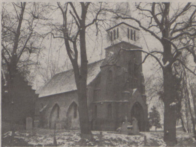
W latach 1588 - 1623 kościół był wspólnym „domem modlitwy” katolików i ewangelików

Pierwsza wzmianka o kościele (niegdyś pod wezwaniem św. Maryi) pochodzi z 1201 roku. Można więc przyjąć, że świątynia została zbudowana w II połowie XII wieku. Na przełomie XV i XVI wieku na miejscu starego wzniesiono nowy kościół mуро-