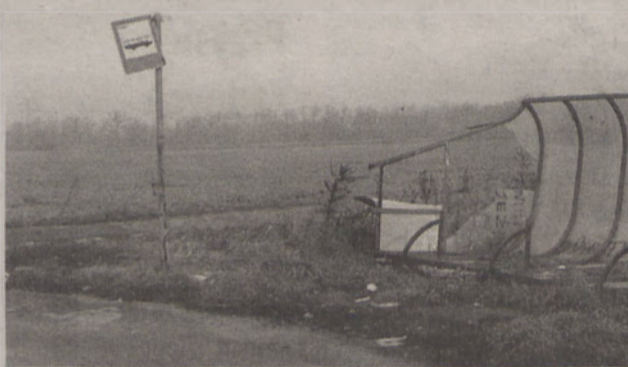
Taka wiata nie daje schronienia przed deszczem czy śniegiem