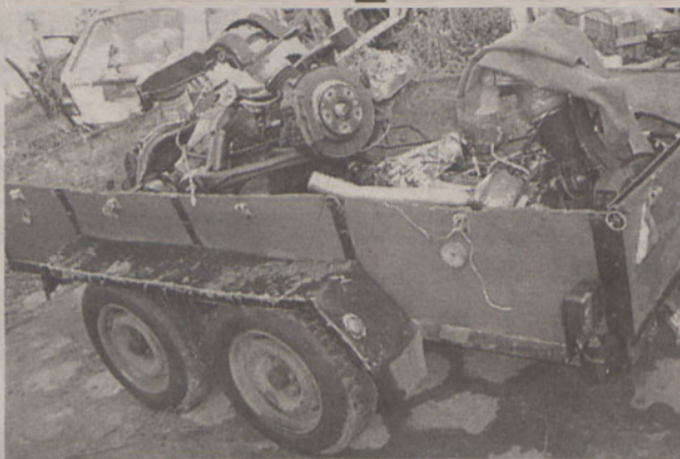
Złodzieje kradli i rozkręcili tylko najlepsze marki

W nocy z 30 listopada na 1 grudnia policjanci odkryli w domu w Świętej Katarzynie skład kradzionych części samochodowych i plantację marihuany.