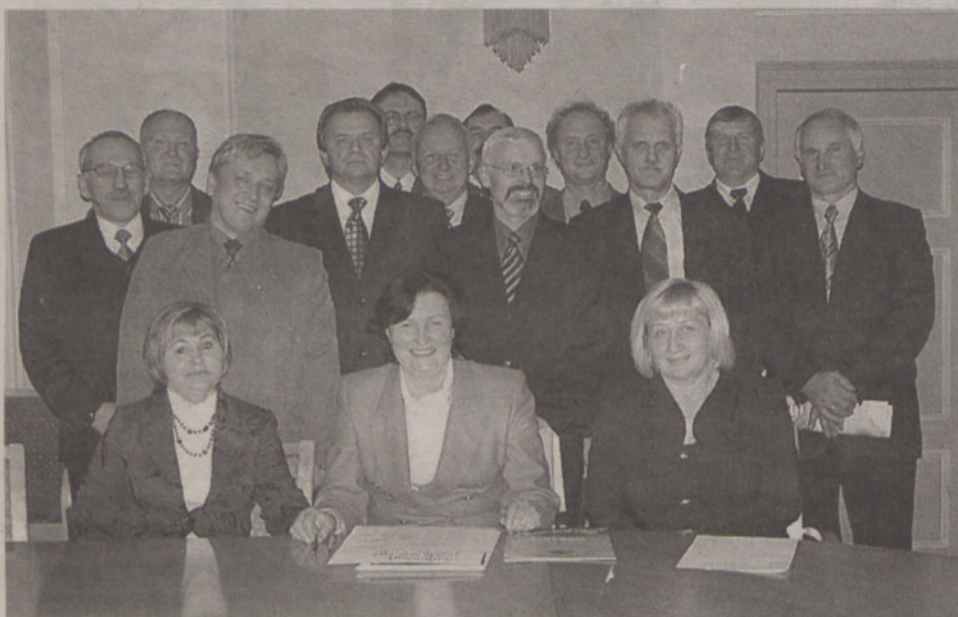
Rada Gminy Kobierzyce kadencji 2006 – 2010