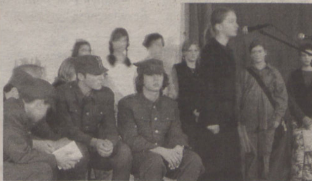
Fragment przedstawienia gimnazjalistów

Weterani walk o niepodległość Polski obejrżeli spektakl historyczny przygotowany przez gimnazjalistów z Sobótki.