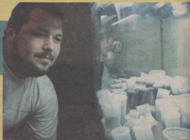
W pojemnikach zamkniętych w terrarium z jaj wykluwają się malutkie ptaszniki