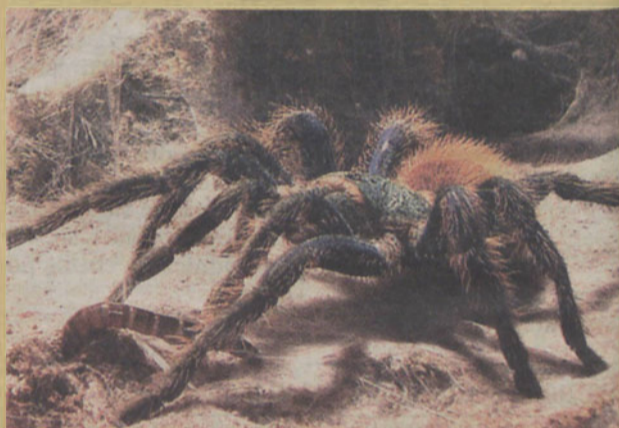
Jeden z pająków w terrarium