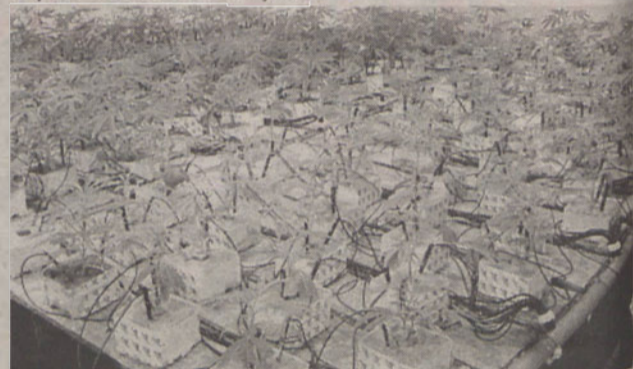
Dla sadzonek stworzono cieplarniane warunki

Policja prowadzi dalsze śledztwo w obu sprawach i nie wyklucza kolejnych zatrzymań. Oskarżonym o paserstwo i uprawę konopi grozi kara do 5 lat więzienia. E.M.