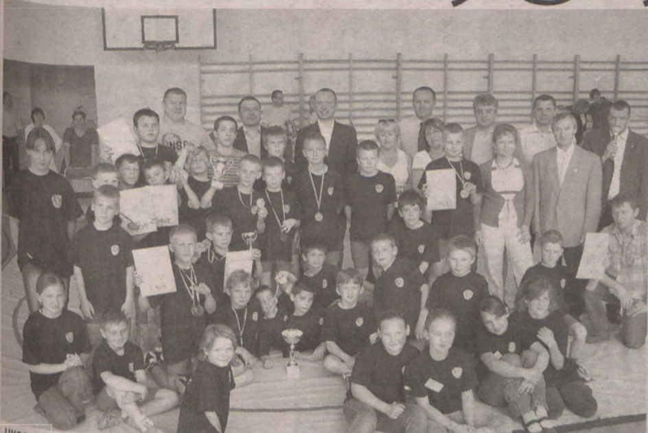
UKS Tygrysy Smolec ze swoimi trofeami na pamiątkowym zdjęciu, do którego zaprosili też wszystkich gości z sobotniego turnieju.