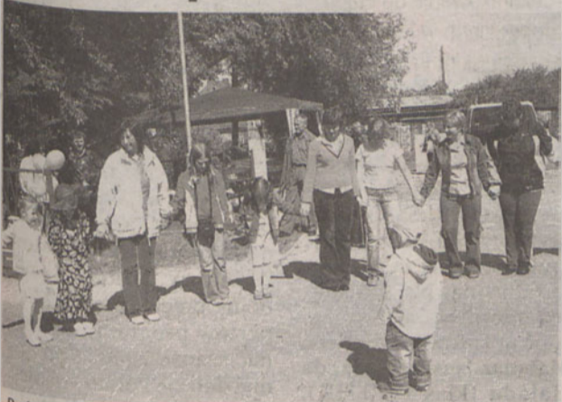
Rodzice zostali zaproszeni do wspólnej zabawy

28 maja przed budynkiem Gminnego Ośrodka Kultury w Długołęce było bardzo barwnie i gwarno. Z okazji Dnia Matki i Dnia Dziecka odbył się festyn z mnóstwem atrakcji.