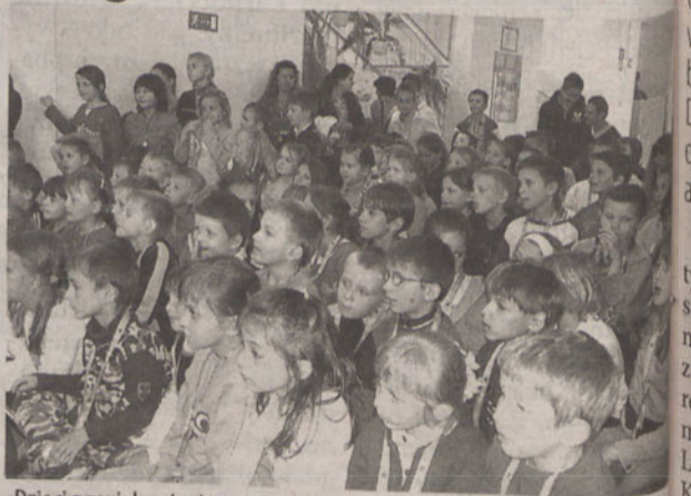
Dzieci z zaciekawieniem oglądały pokaz iluzjonisty

2 czerwca w szkole podstawowej w Gniechowicach był gwarniej niż zwykle. Tego dnia nie było bowiem lekcji, tylko imprezy i zabawy związane ze świętem szkoły i Dniem Dziecka.