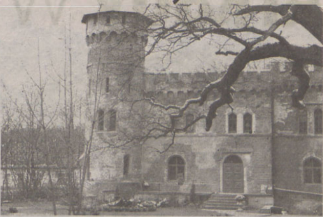
Kilkusetletni dąb strzeże dostępu do dworku

Obiekt w Domaszczynie powstał w II połowie XIX wieku na miejscu dawnej siedziby właściciela wsi, zwanej Tivoli. Ten neogotycki budynek w stylu angielskim został zaprojektowany przez architekta księcia Wilhelma – Wolfa . Bo-