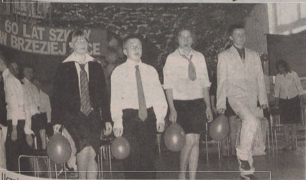
Uczniowie przypomnieli pieśni śpiewane przed kilkudziesięciu laty

Sześćdziesiąt lat temu dobiegał końca pierwszy powojenny rok szkolny w Brzeziej Łące, zwanej jeszcze wtedy Konradowem. 150 uczniów kształciło się tam pod kierunkiem dwójga nauczycieli.