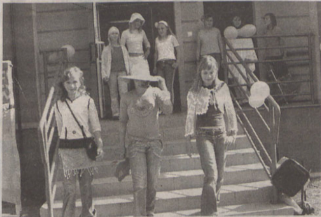
Modelki z gracją zaprezentowały wakacyjne stroje