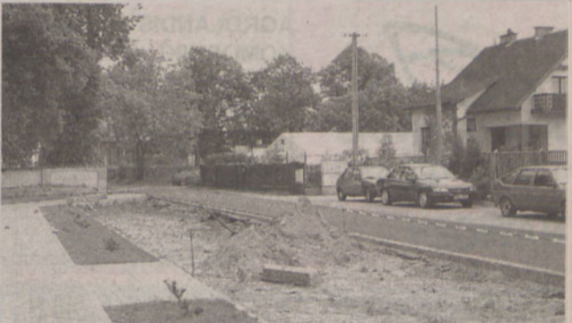
Uczniowie będą niedługo cieszyć się z jeszcze wygodniejszej drogi do gimnazjum w Borowej

Z nadejściem wiosny w gminie Długołęka wznowiono prace budowlane. Niedawno ruszyła długo oczekiwana budowa drogi Pruszwice – Domaszczyn, na odcinku 1100 metrów. Przewidywany koszt wyniesie 2 mln 274 tys. zł.