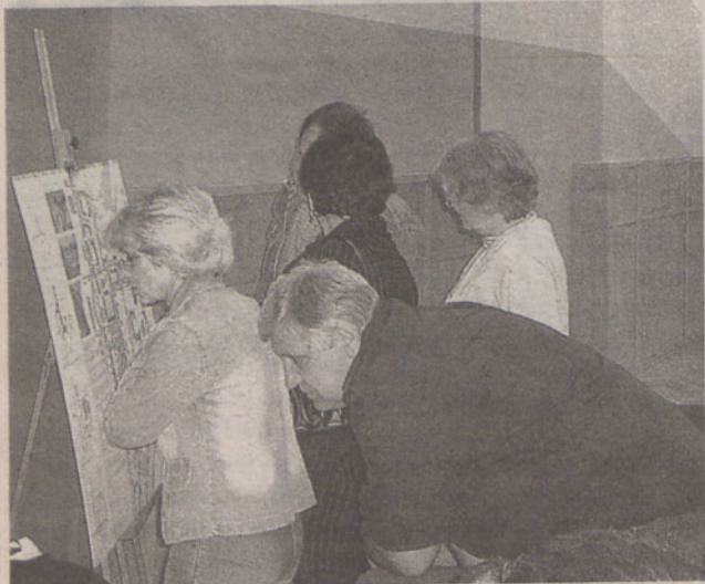
Mieszkańcy Kobierzyc z uwagą przyglądali się planom rewaloryzacji