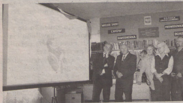
Honorowymi gośćmi uroczystości byli najstarsi mieszkańcy gminy

Przeoglądanie na ekranie komputera zdjęć i map, zgłębianie wspomnień z odległych czasów, a nawet poznanie różnorodnych tradycji kulinarnych. To wszystko jest możliwe w Centrum Multimedialnym Retrotece w Gminnej Bibliotece Publicznej w Świętej Katarzynie.