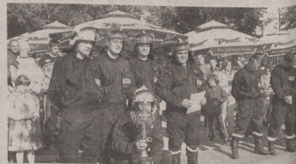
W Pustkowie Żurawskim nie obył się bez zawodów strażackich

Pod koniec maja rozpoczął się sezon pikników i festynów na terenie gminy Kobierzyc.