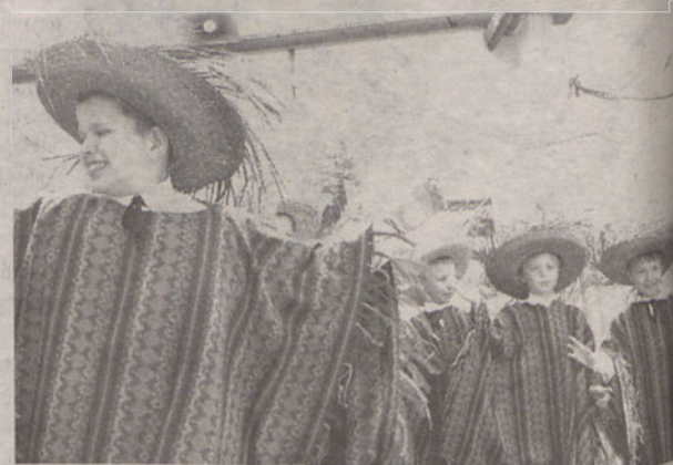
Dzieci wcieliły się w Meksykanów w ponchach i sombreroach

Pomysłowość nauczycieli i uczniów Szkoły Podstawowej w Radwanicach pozwoliła zwiedzić w wyobraźni odległe kraje.