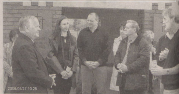
Delegacja z Borken przed wizytą na cmentarzu w Nadolicach Wielkich

Delegacja z niemieckiego powiatu Borken zwiedzała cmentarz żołnierzy niemieckich w Nadolicach Wielkich.