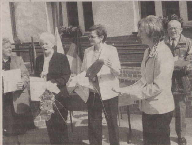
Ci nauczyciele poświęcili szkole większość życia

Przedstawiciele samorządu uczniowskiego udali się następnie na cmentarz, by złożyć kwiaty na grobach zmarłych nauczycieli. W tym czasie goście zostali zaproszeni do zwiedzania szkoły, a potem do obejrzenia przygotowanego przez uczniów programu artystycznego. E.M.