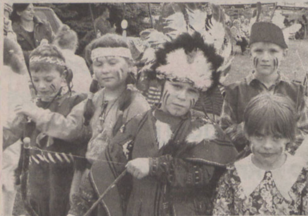
Apacze z globalnej wioski

Ponad 700 złotych zebrała szkoła podstawowa na festynie podczas licytacji. Pieniądże zostaną przeznaczone na zakup sprzętu do sali językowej.