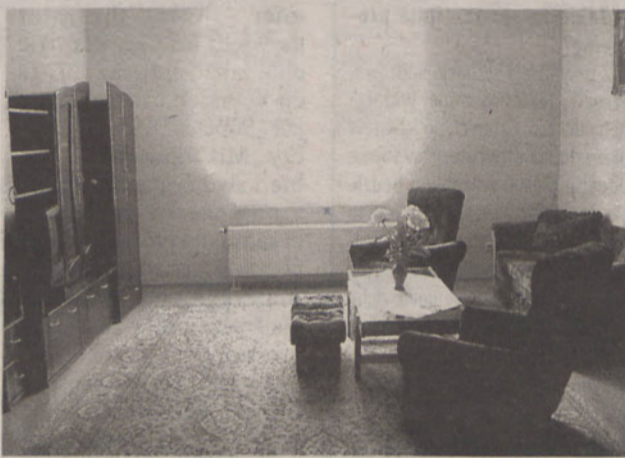
Pokoje są wyremontowane, ładne i w pełni wyposażone

Czy jest szansa na obsługę bezrobotnych w Kątach Wr.?