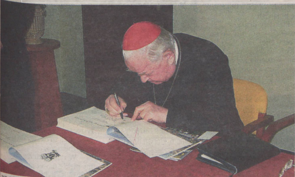
Większość uczestników spotkania prosiła o dedykację „ojca chrzestnego” monografii, kardynała Henryka Gulbinowicza