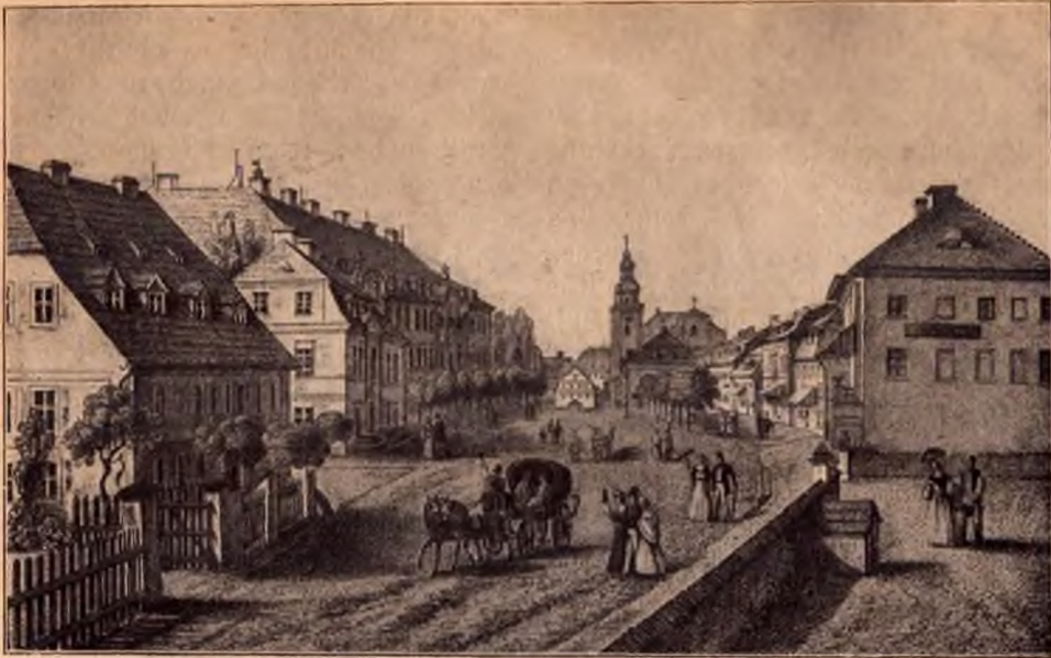
Warmbrunn vor hundert Jahren: Bild auf den Schloßplatz und die katholische Kirche

Liebe nach dem Unterschiede der Stände fragt. Gesundheit suchen, ist der gemeinschaftliche Zweck! Warum also noch in der nackten Hülle jenes erbärmliche Titelwerfer, oder gar jene hochfahrende imposante Manier, deren einige sich befehligen?"