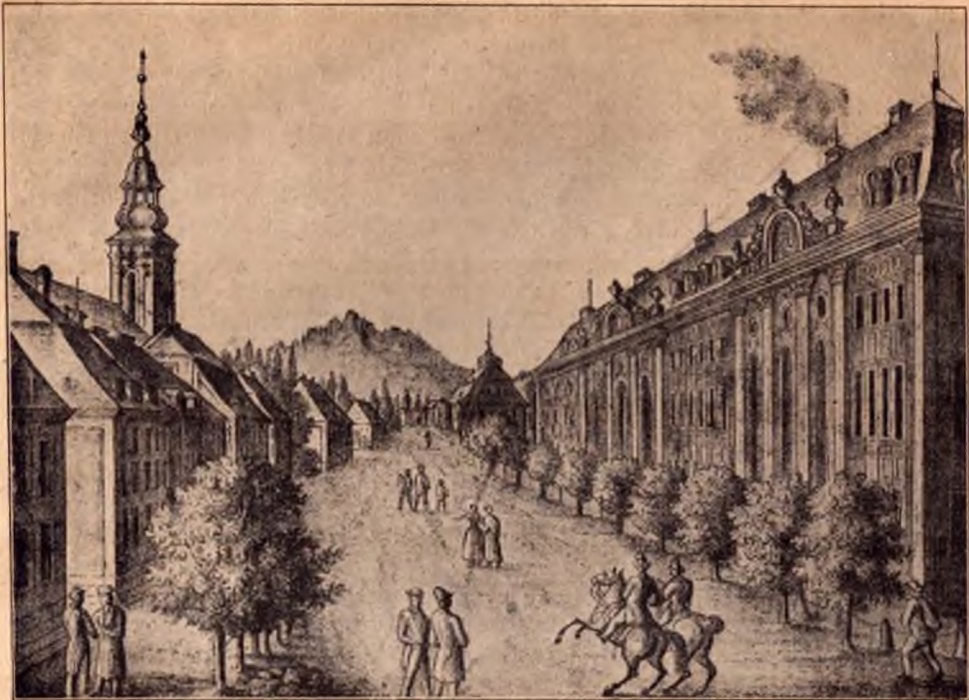
Warmbrunn vor hundert Jahren: Der Schloßplatz mit Blick auf den Scholzenberg

die den Männern desselben Standes den Platz räumen; endlich baden die gemeinen Weiber (vergessen sie nicht, daß ich in der hier gewöhnlichen Technologie schreibe), worauf die gemeinen Bürger des Vormittags den Beschluß machen. Des Nachmittags fängt dieselbe Ordnung von neuem an . . . . Ubrigens pflegt man es so einzurichten, daß in den Stunden, die in dem propsteilichen Bade für die Männer angelegt sind, in dem gräflichen die Frauen baden . . . Ist die Auswahl der Badegäste nicht zu groß, dann werden jeder Klasse jedesmal 1\frac{1}{2} Stunden eingeräumt; im entgegengesetzten Falle darf jeder Stand nicht über eine Stunde baden.“