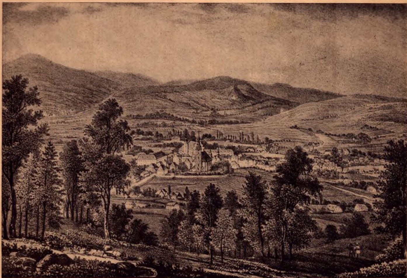
Bad Warmbrunn. Nach einem Steindruck aus dem Anfange des 19. Jahrhunderts