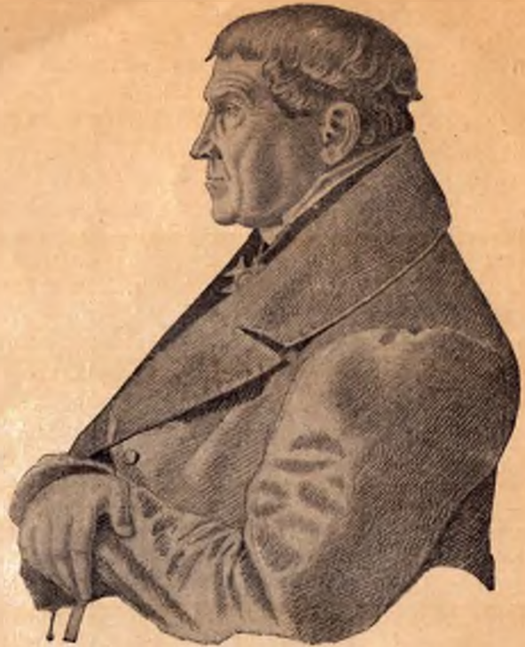
Can. D. Klant empfiehlt sich fernern Wohlwollen des Künstlers Warmbrunn, 31. Juli 1837

Das unentwidelte Gasthauswesen Warmbrunn's brachte es mit sich, daß sich die Badegäste noch bis ins 19. Jahrhundert hinein vielfach selbst betätigten. 1795 gibt es nur im „Abler“ öffentliche Wirtshausstafel. Man speist in einem Zimmer, „der Saal“ genannt, das durch ein Billard und eine Galanteriewarenbude eingeengt wird. 1797 sind zwei „Traiteurs“ vorhanden. 1808 kommt als dritte Gaststätte die Galerie hinzu. Das Essen im „Abler“ wird schlecht gefunden. Noch schlechter der Tisch bei