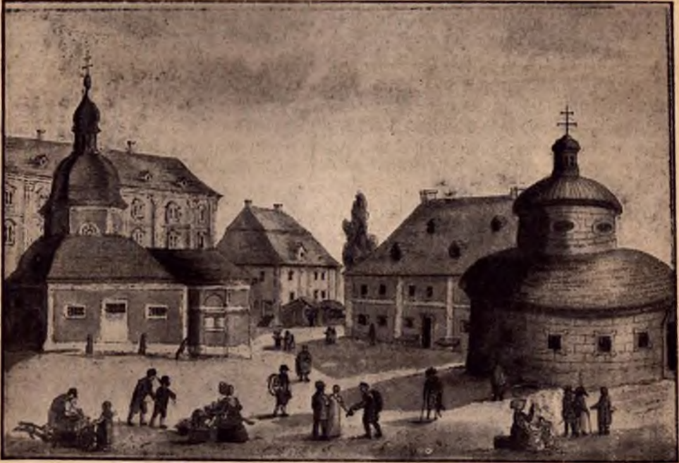
Das Straßenge und das Probier-Bad zu Warmbrunn in Schlesien, radirt von G. A. Tittel

Badeort und in diesem Badeorte keine anziehende Natur. Dazu galt Freienwalde als eines der teuersten Bäder, das Bad des reichen mecklenburgischen und pommerschen Adels. Auch der märkische Landadel frequentierte es, während wir den Berliner Hofadel, wenigstens im 19. Jahrhundert, häufig in Warmbrunn antreffen. Dabei hat