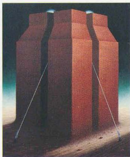
Marian Kępiński, Wieża nieprawości, 1987 r.