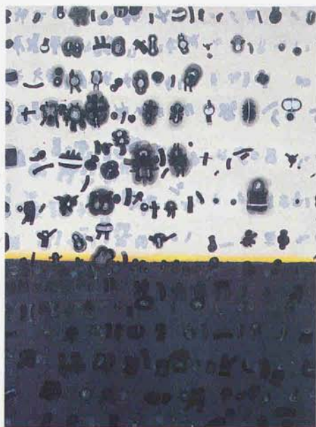
Jan Tarasin, Opadanie , 1974 r.