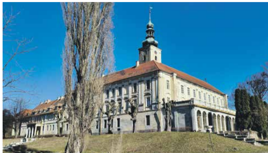
Palac w Oleśnicy Małej

Oleśnica Mała to wieś w powiecie oławskim, położona około 40 kilometrów od Wrocławia. W jej środku wznosi się malowniczy, choć bardzo zaniedbany, zespół pałacowy będący obecnie siedzibą Zakładu Doświadczalnego Hodowli i Aklimatyzacji Roślin, otoczony dwudziestohektarowym parkiem.