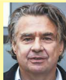
Autor jest reportażystą, felietonistą, powieściopisarzem.

godzinę. I aby nie szczuli kierowców strażą miejską, bo ktoś, kto przyjeżdża do ich miast, by zrobić tam zakupy, doznać rozrywki lub kultury albo po prostu pracować, nie może czuć się jak żydowskie dziecko, które w 1943 wyszło na chwilę z piwnicy na warszawską ulicę. Co wygłosiwszy, rozejrzałbym się po zebranych, aby się zorientować, czy nie ma wśród nich przedstawicieli niemieckiej motoryzacji. Albo wręcz przeciwnie – aby się upewnić, że właśnie tam są.