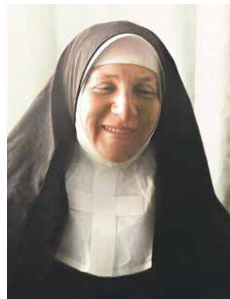
Bł. Róża Czacka

„Patrzymy na Matkę... Inaczej jej tu nie nazywaliśmy. Nie tylko siostry zakonne i rodzina niewidomych, ale i my, kapłani, którym dane było w różnych okresach rozwoju Dzieła przejść przez Łaski... czerpaliśmy z bogatego ducha naszej Matki i duchowości tego ubłogosławionego przez Boga miejsca... Testamentem Matki jest Jej życie. Miała ona dwoje rąk, nie miała oczu, miała jedno serce” – mówił.