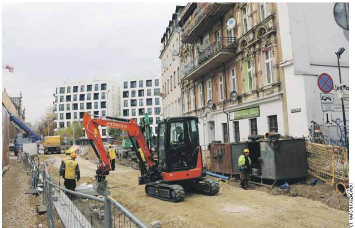
Jeden z wrocławskich placów budowy

usług nie była niższa niż wysokość obowiązującej minimalnej stawki – stwierdzono w 49 przypadkach;