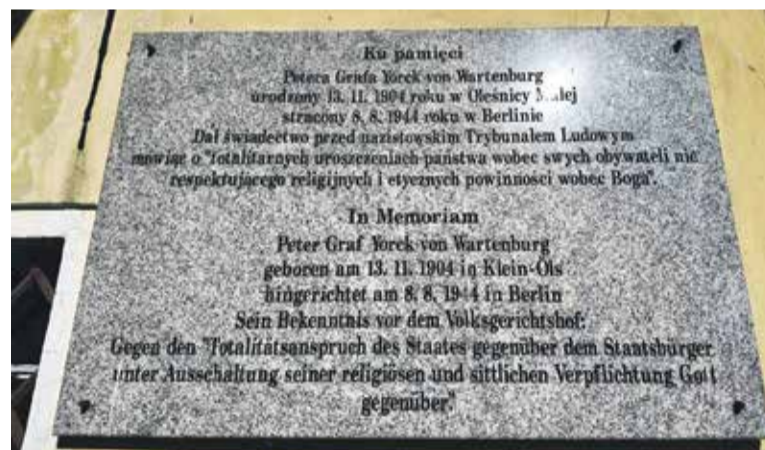
Tablica upamiętniająca Petera Yorck von Wartenburg

A teraz już całkiem serio: ostatni właściciel majątku Peter graf Yorck von Wartenburg nie spoczął u boku swych przodków. Za udział w działalności antyhitlerowskiego Kręgu z Krzyżowej został stracony 8 VIII 1944 roku w Berlinie-Charlottenbur-