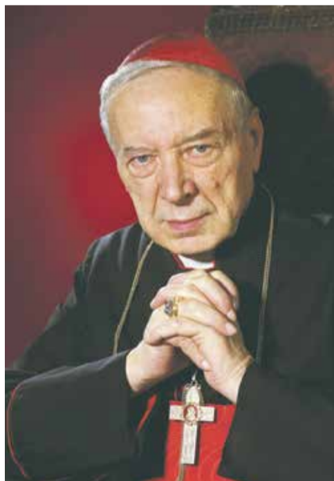
Bł. kard. Stefan Wyszyński

nego życia, odkrywali, że mogą być szczęśliwi i uczyli się przede wszystkim godności. Matka Czacka, która sama straciła wzrok, całą sobą wskazywała, że niewidomi są powołani – podobnie jak zdrowi – także do odpowiedzialności za Ojczyznę. Jej duchowość – głęboko zakorzeniona w tajemnicy Krzyża – nie była sentymentalna. Była wymagająca.