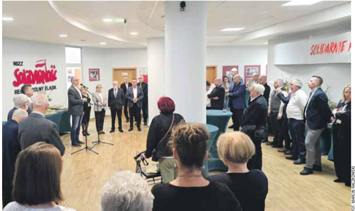
Świąteczne spotkanie w holu ZR

Światowy Dzień Pamięci Ofiar Wypadków przy Pracy i Chorób Zawodowych