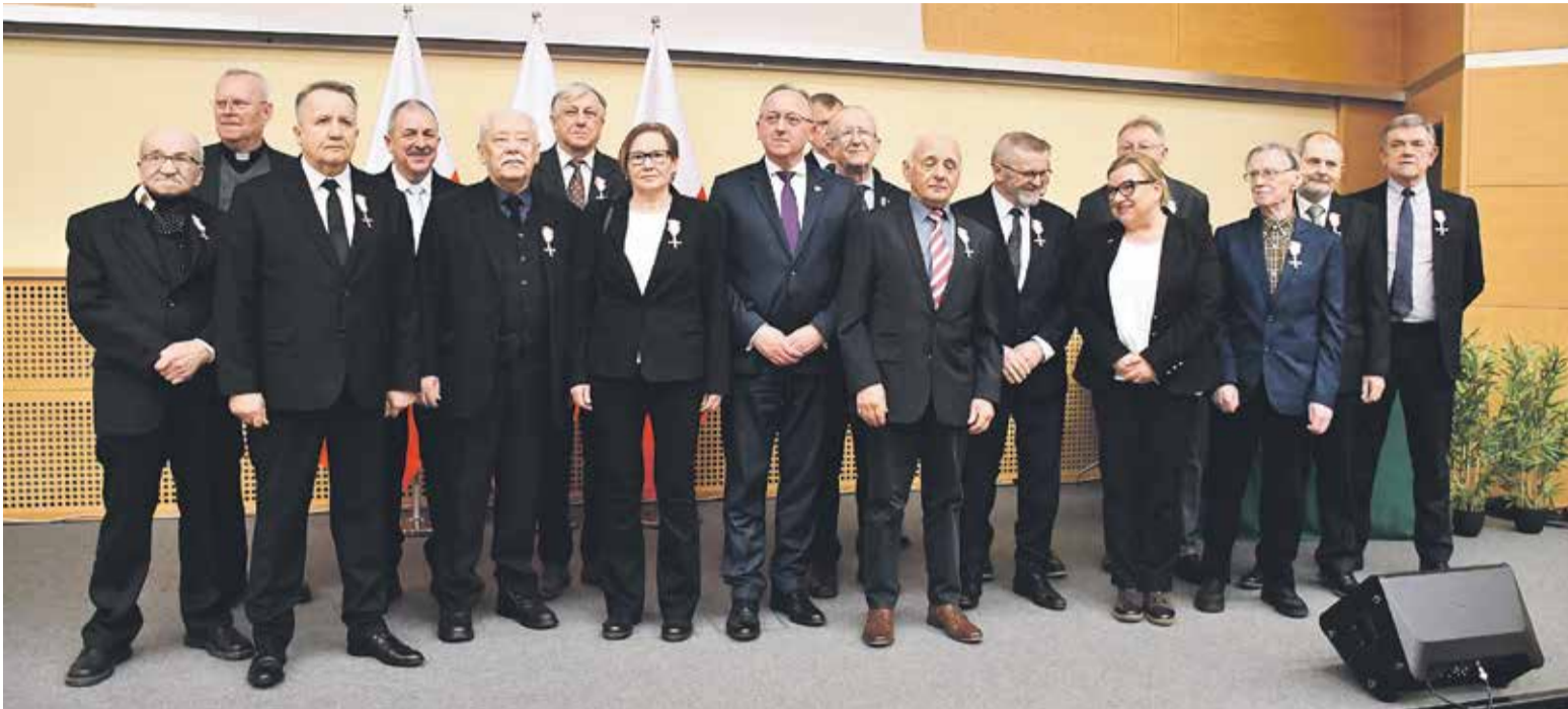
Wspólne zdjęcie odznaczonych