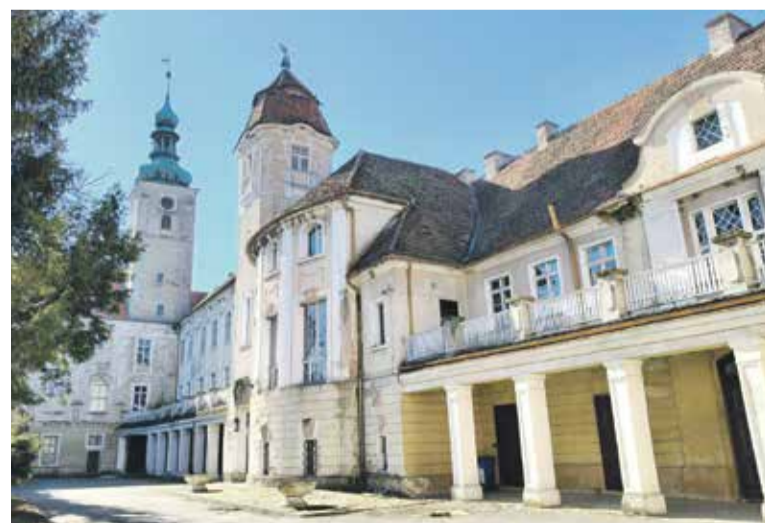
Palac i kościół na drugim planie