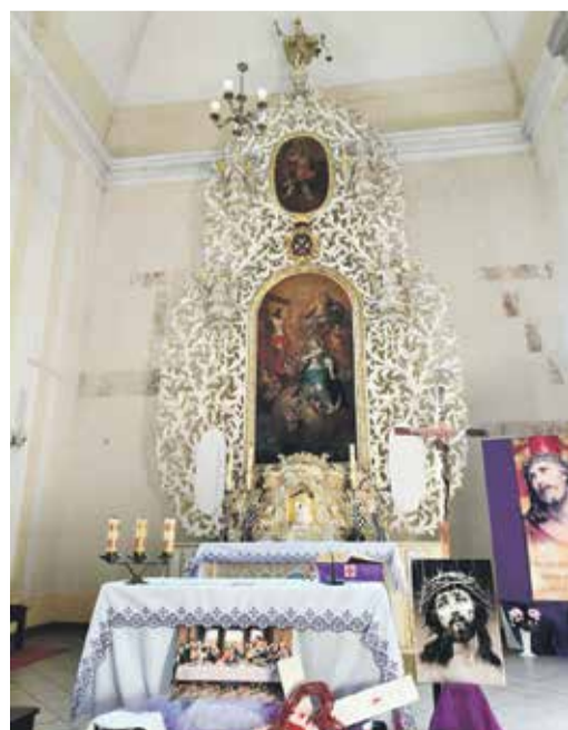
Ołtarz główny w kościele

Najprawdopodobniej pod koniec XII wieku książę Bolesław I Wysoki wznosił tutaj myśliwski gródek z kaplicą. Jego syn Henryk Brodaty za namową żony św. Jadwigi Śląskiej z Andechs przekazał posiadłość templariuszom, zakonowi rycerskiemu wielce zasłużonemu w walkach o Ziemię Świętą. Mnisi przybyli z Brunszwiku i założyli w Oleśnicy Małej swą komandorię. Przebudowali i rozbudowali dawny książęcy zameczek, zaczęli zakładać nowe wsie, a kaplicę (czyli pierwotny kościół leżący w innym miejscu niż dzisiejsza świątynia) ozdobili z czasem bogatym zbiorem relikwii przeróżnych świętych, w tym Jadwigi Śląskiej, ich dobrodziejki. Podzie-