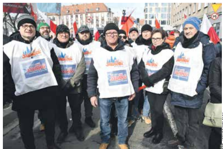
Członkowie MOZ Pracowników Przemysłu