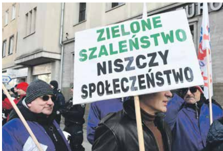
Protestujący z hasłami

Polski niesie ogromne zagrożenie. Po pierwsze, zagraża strategicznemu bezpieczeństwu żywnościowemu Polaków, po drugie, uderza w polskich rolników, wprowadzając nieuczciwą konkurencję i tym samym powodując upadek gospodarstw rolnych i zwiększając szereg bezrobotnych. Dlatego MY, sygnatariusze tego listu, reprezentujący Solidarność stanowczo domagamy się natychmiastowej rezygnacji z ideologicznego podatku ETS, zaprzestania dezinformacji dotyczącej szkodliwości stosowania paliw kopalnych, cofnięcia wszelkich decyzji dotyczących ograniczania i zakazu stosowania paliw kopal-