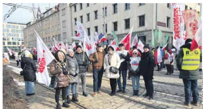
Członkowie Organizacji Międzyzakładowej Pracowników Telekomunikacji

Działacze wręczyli przedstawicielowi Biura Parlamentu Europejskiego list otwarty, w którym napisali m.in. „Restrykcyjne ograniczenie spalania paliw kopalnych oraz nałożenie na ich stosowanie ideologicznego podatku ETS, spowodowały drastyczne wzrosty cen energii, a tym samym uderzenie w rozwój gospodarczy państw, widocznie rosnącą liczbę utraconych miejsc pracy oraz obniżanie standardów życia obywateli. W ramach tzw. Zielonego Ładu marginalizuje się energetykę konwencjonalną, stawiając na niestabilne źródła energii odnawialnej. Nie prowadzi się dyskusji publicznej i ignoruje się eksperymenty naukowe mówiące o urealnieniu wpływu dwutlenku węgla na atmosferę ziemską. Jako „Solidarność” od zawsze staliśmy na straży wolności wypowiedzi i uważamy