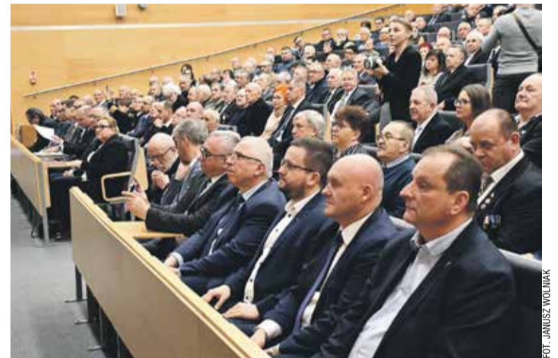
Uroczystość odbyła się w sali Politechniki Wrocławskiej