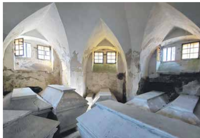
Krypta pod mauzoleum

doria wraz z kościołem, którego już nie odbudowano. W latach 1706–1711 podniesiono z pożogi cały kompleks, zaś na nową świątynię przeznaczono południowe skrzydło pałacu, co oznacza, że joannici mieli nadal tak zwaną płynność finansową. Ten nowy, barokowy kościół pod wezwaniem św. Wawrzyńca to budowla murowana, jednonawowa, przykryta sklepieniem kolebkowym. Dziś wyposażenie wnętrza, choć ciekawe, wydaje się dosyć skromne: barokowa ambona, prospekt organowy, dwa urokliwe ołtarze boczne, przede wszystkim jednak (również barokowy) ołtarz główny – bardzo wysoki, z konterfektem patrona świątyni i obrazem przedstawiającym najprawdopodobniej Wniebowzięcie NMP. W lewym dolnym rogu obrazu widać budynek klasztoru w Oleśnicy Małej, zaś