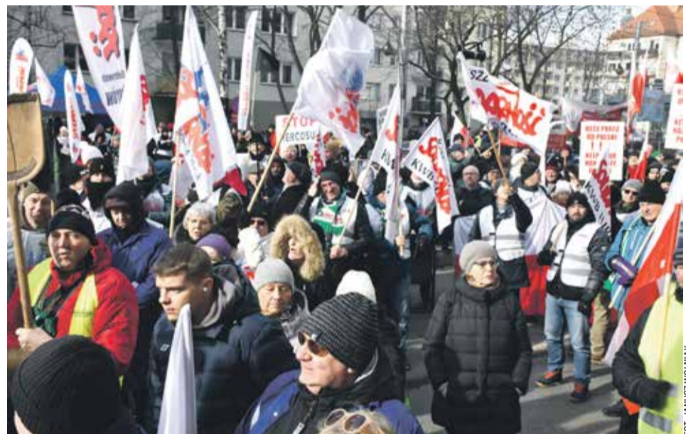
W wydarzeniu wzięło udział kilkaset osób

warunki pracy, zatrudnianie dzieci, ochrona środowiska na minimalnym poziomie lub jej brak, produkty niższej jakości i wątpliwe pod kątem bezpieczeństwa dla ludzi – to wszystko przestaje mieć znaczenie w oczach władz UE? Umowa z krajami MERCOSUR z perspektywy