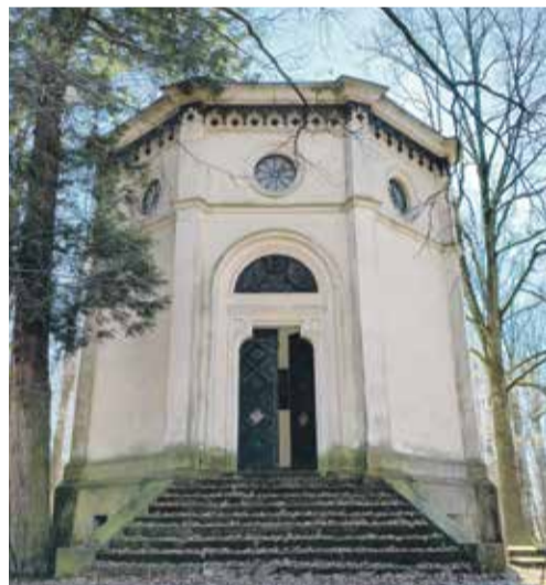
Mauzoleum rodu Yorck von Wartenburg

nia dzisiejszego pałacu kryją relikty komandorii Rycerzy Templum. Strome i wysłizgane schody prowadzą do piwnic i korytarzy, w których między innymi odnaleziono krypty ze szczątkami mnichów i pomiesz-